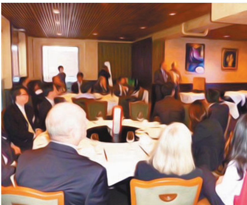
內地一些地方到境外招商活動出現過度奢華的問題,引起商務部關注。

而在內地實際使用外資層面,8月份比上月增速有所回落,當月錄得83.77億美元,同比增長0.62%;內地前八個月實際使用外資金額797.7億美元,同比增長6.37%。沈丹陽回答記者提問時指出,這種變動不足以反應中國外資整體走勢的變化。他預計,今年全年實際引資規模有望高於去年。