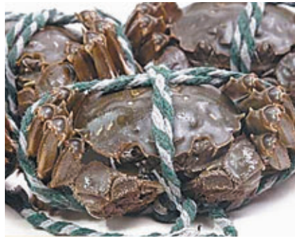
陽澄湖大閘蟹禮券最高面值達人民幣3,988元。網上圖片

此外,與網購禮品並通過快遞寄送相比,電子禮品卡和禮品券的出現,讓送禮方式更加隱蔽。不少電商都推出了電子禮品卡或禮品券,只要輸入卡號、密碼,就可以完成支付。送禮者通過短信把卡號和密碼發給收禮人,即完成了送禮過程。這些電子禮品卡和禮品券對應的商品,既有普通的食物飲料,也有日用品、母嬰用品、家居用品等,還有高檔包包、手錶等奢侈品。相關的客服亦表示,發票內容既可以開「禮品」,也可以開成「服務費」或是「諮詢費」。