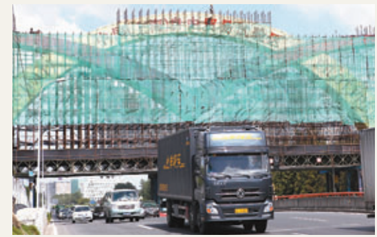
工人昨日在上海浦東外高橋區域搭建「中國(上海)自由貿易試驗區」字樣。

另有消息稱,上海綜合保稅區相關人士透露,中國(上海)自貿區目前確定為29日掛牌,10月1日正式啟動,先期將啟動56項試點,今年年底前再啟動42項試點。該人士同時表示,金融開放的步伐會稍微緩慢,先期啟動的56項改革中包括小部分金融開放內容,後續的開放將在年底前啟動。