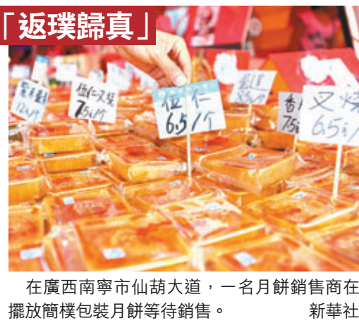
在廣西南寧市仙葫大道,一名月餅銷售商在擺放簡樸包裝月餅等待銷售。

從百姓身邊的題材入手,增強互動交流,把舞台延伸到普通觀眾中間,讓他們從被動欣賞者轉變為主動參與者,突顯出「聯歡」主題。江蘇衛視、浙江衛視、湖南衛視均表示,今年將不舉辦中秋晚會,改以製作具有節日特色的節目。