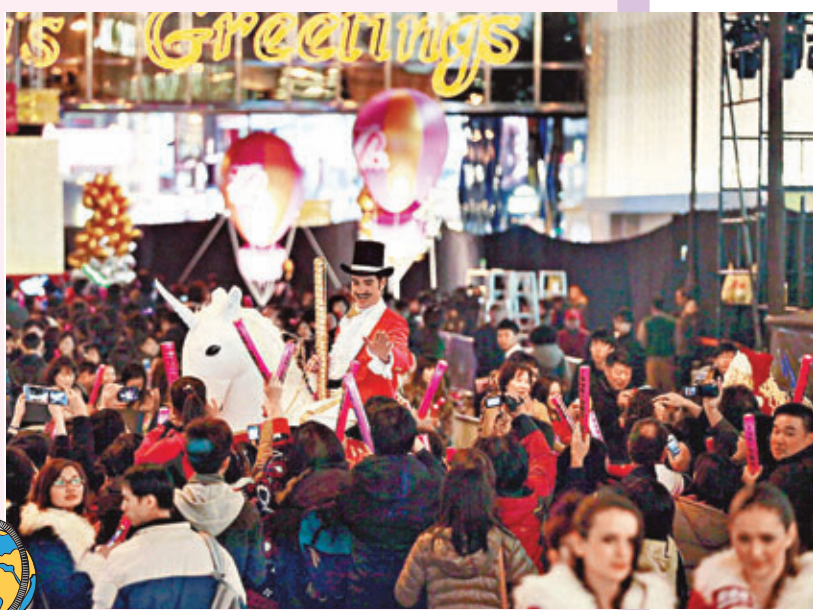
香港尖沙咀廣東道平安夜倒數Party。 資料圖片

不過事後避孕也不獨是少女的專利，根據家計會的研究顯示，在2006年至2008年期間，一共為11,014位人士提供事後避孕服務，只有1.9%在16歲或以下，而且四成為已婚或者行將結婚。其原因除了在性交時沒有使用避孕措施外，有38%的求助者因為使用避孕套時發生意外。再者，有33.8%的求助者學歷達大專或以上程度。因此可見，尋求事後避孕者不一定是無知少女，更不該未婚男女基於一時性衝動，而沒有採取避孕措施。