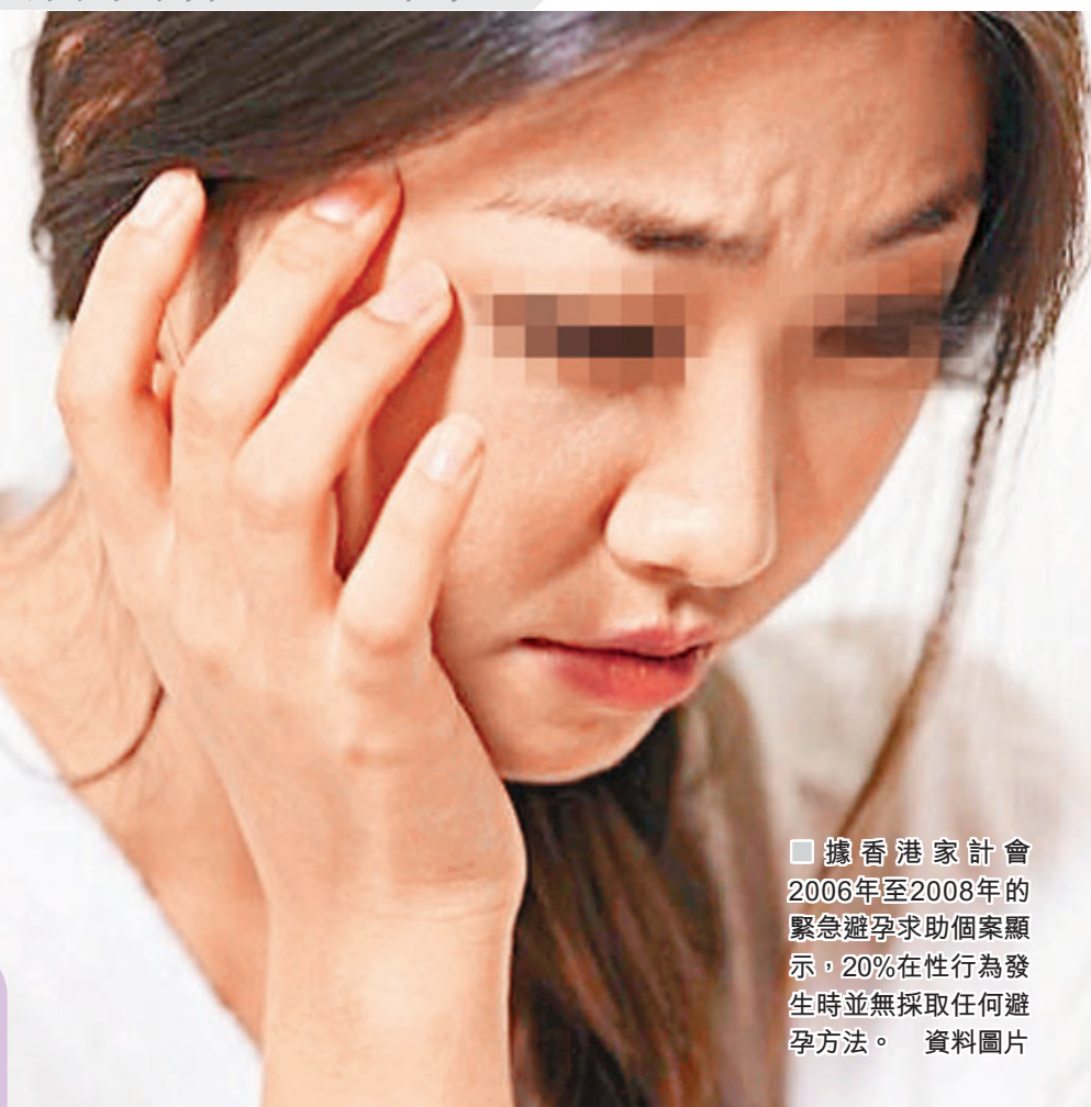
據香港家計會2006年至2008年的緊急避孕求助個案顯示，20%在性行為發生時並無採取任何避孕方法。 資料圖片