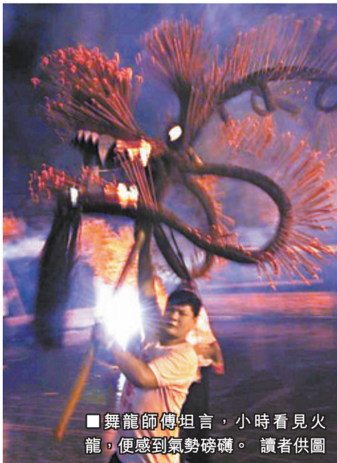
■舞龍師傅坦言，小時看見火龍，便感到氣勢磅礴。

香港文匯報訊（記者 郭兆東）中秋舞火龍對市民而言，是具有本土文化特色的節慶活動，但對舞龍師傅來說，除了是每年大展拳腳的機會，更具有與親朋好友人月兩團圓的雙重意義。已在大坑舞火龍多年的誠哥及威哥表示，雖然為傳承本土文化，定必繼續「舞下去」，但笑言當日已搬走的鄰居及家人都會「自動蒲頭」，對於能享受當中再聚首一堂的歡悅，才是真正堅持下去的原動力，坦言希望日後隨各人成家立室，可繼續為舞火龍的大家庭增添新血，將這項具社區及傳統意義的活動傳承下去。