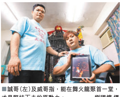
■誠哥(左)及威哥指，能在舞火龍聚首一堂，才是堅持下去的原動力。

威哥對此亦表贊同，指每年中秋即使日常工務繁忙，「但個個都會去咗大坑」；同時，為了遷就舞火龍的時間，家人亦會提前做節團聚，其他多年不見的舊鄰亦會在毋須聯絡的情況下，自動自覺在中秋前後「蒲頭」，回到小時候的居所附近「飲茶聚頭」，閒話當年。誠哥則表示，希望能將舞火龍的技術「一代傳一代」，並指自從早前邀請現任女友觀賞火龍後，女友對整項活動的支持度與日俱增，故誠哥有信心在日後成家立室後，可以將自己懂得的技巧及文化，留給自己的子女及子女的子孫，真正做到文化傳承的目標，亦同時壯大火龍的家庭，為日後的習俗增添新血。