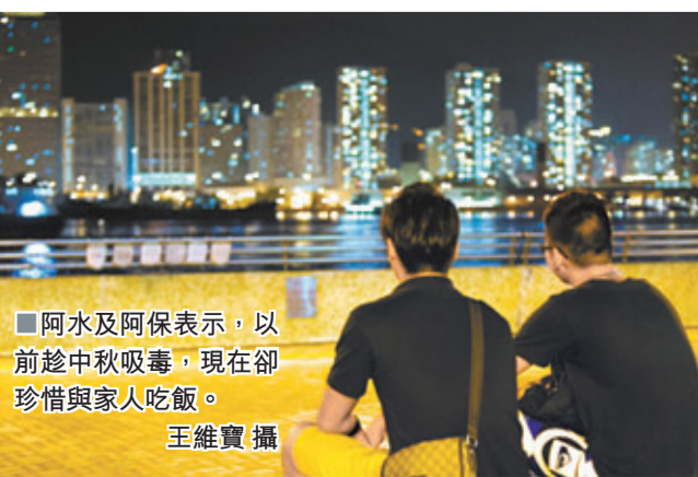
■阿水及阿保表示，以前趁中秋吸毒，現在卻珍惜與家人吃飯。

其後阿水自覺在吸毒後令身體不斷轉差，所以決定戒毒，「看到身邊吸毒的朋友好像愈來愈弱智一樣，加上自己的身體都有受到影響，所以決定不能再吸毒」。而阿保則在一次警方的截查中，被發現身上藏有毒品，最終在接受戒毒服務後，成功戒毒。現時阿水任職救生員工作，而阿保則繼續就讀中五，他們都非常珍惜這次改過自新的機會，自此都沒有