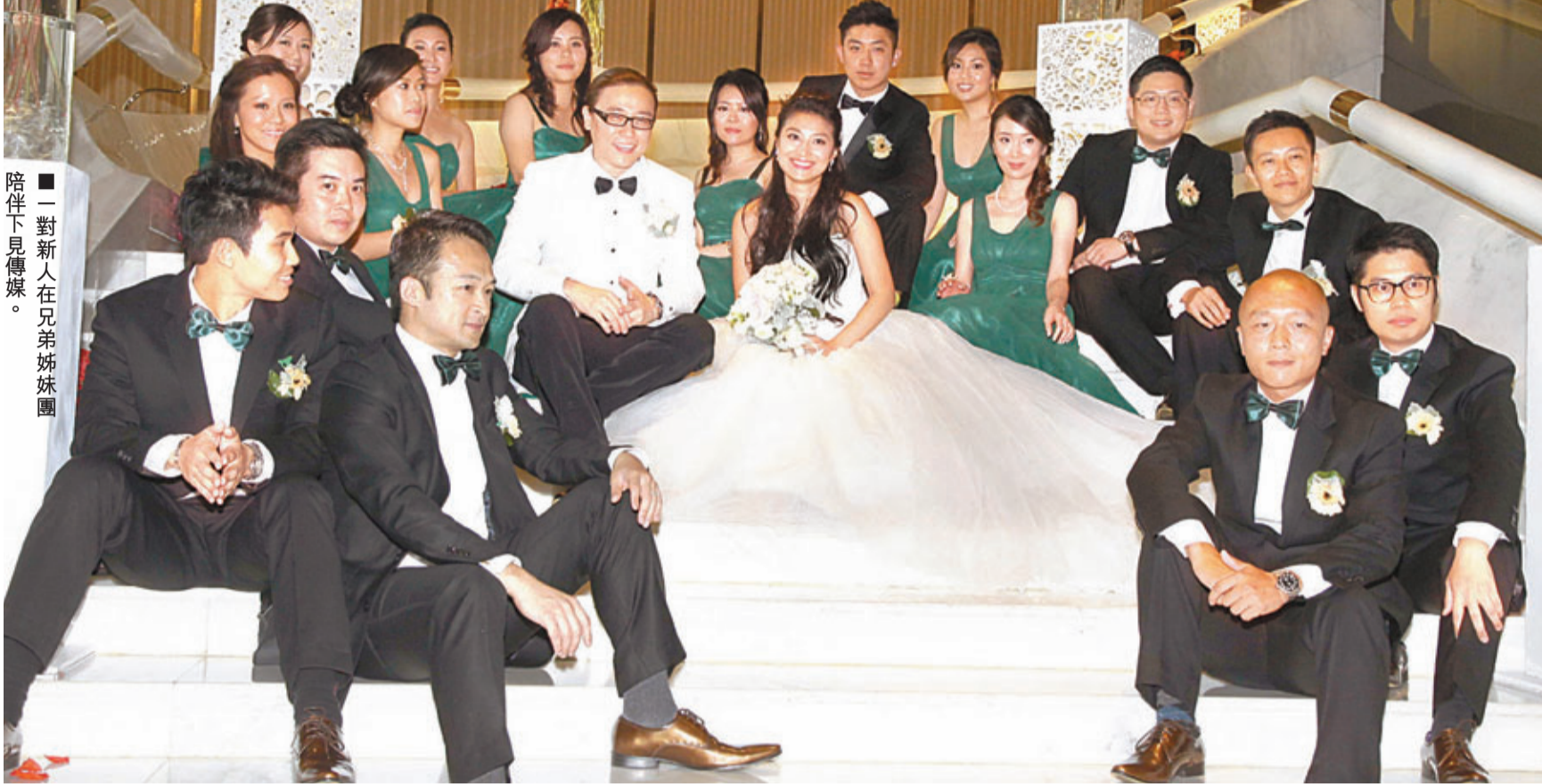
一對新人在兄弟姊妹團陪伴下見傳媒。