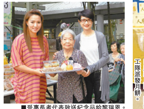
受惠長者代表致送紀念品給黎瑞恩。

香港文匯報訊 黎瑞恩最近為慈善重返舞台，舉行一連兩場的「黎瑞恩All For Love慈善演唱會2013」，為致力於服務獨居長者由義工組成的慈善機構榕光社籌款。中秋將近，榕光社昨日在慈雲山舉行「同心月滿迎中秋」之禮包送贈活動，黎瑞恩聯同盧敏儀、金至尊珠寶、馬天尼義工團隊，在榕光社主席聶揚聲、副主席林桂霞陪同下，上樓探訪7戶行動不便的獨居長者，並贈送內有月餅、水果、冷帽、頸巾、手套以及超市現金券的中秋禮物包。