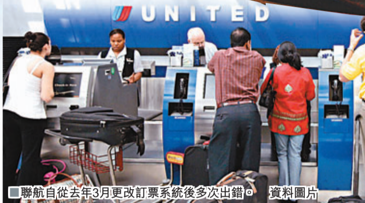
■聯航自從去年3月更改訂票系統後多次出錯。資料圖片