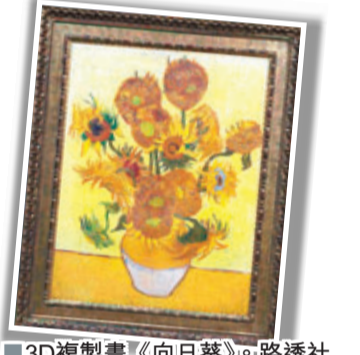
■3D複製畫《向日葵》。