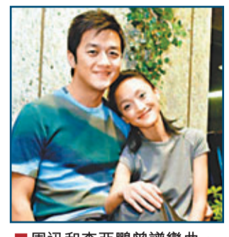
周迅和李亞鵬曾譜戀曲。

香港文匯報訊(記者 焯玲) 歌星王菲自2005年與李亞鵬結婚生女後定居北京，近十年來幾乎絕跡香江，在京城專心相夫教女，昨日驚爆婚變消息，而且「婚變炸彈」由王菲在微博上引爆，稱夫妻緣盡至此。其後李亞鵬亦親自證實與王菲分手，8年的婚姻劃上句號，兩人的女兒李嫣由他撫養。李亞鵬心情似充滿無奈，更希望王菲快樂！