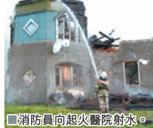
消防員向起火醫院射水。

俄羅斯一間精神病院昨日發生火災，造成至少37人遇難，當局正調查起火原因，不排除有人故意縱火。今次是俄國年內第2宗精神病院火災，或促使外界關注精神病