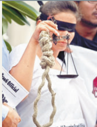
判刑前，有示威者在法院門外要求吊死犯人。

印度新德里去年12月發生轟動全球的巴士輪姦案，4名犯人昨日全部被判死刑。法官康納稱「女性遭性侵犯個案持續上升，不能視而不見，須發出訊息表明(社會)不容忍罪行」，又指事件對社會集體良知造成衝擊，屬於「罕有案件」。受害23歲女大學生的父親對正義得以彰顯感到高興，不少網民亦在微Twitter留言歡迎判決，有人稱「感謝神……神確存在！終於都有正義！」