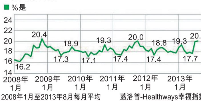
2008年1月至2013年8月每月平均 蓋洛普-Healthways幸福指數