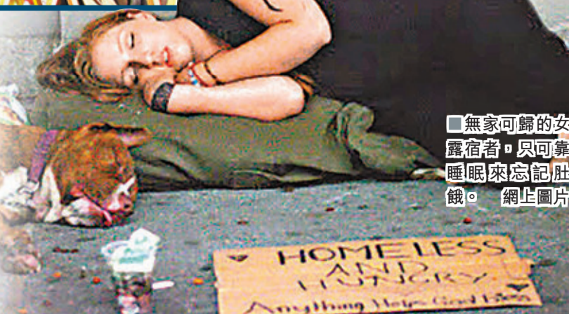
■無家可歸的安露宿者，只可靠睡眠來忘記肚餓。網上圖片