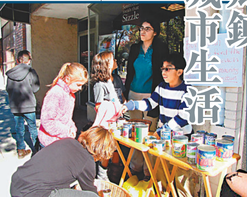
■有團體自發舉行募捐活動，為區內的免費食堂籌募款項。網上圖片

財政部早前警告，美國的債務將於下月中爆發，提高債限刻不容緩。當被問及國會應否提高債限時，只有22%受訪者贊成，44%人反對，另有33%對事件欠認知。 ■CNBC