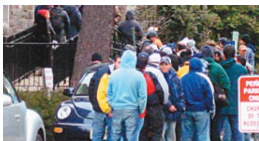
■部分城市會在社區中心派發食物，吸引大批有需要人士輪候。

根據華府上周公布的年度《食物保障》報告，去年有1,760萬個家庭曾出現沒錢買食物、兩餐併一餐或因挨餓致體重下降等情況，