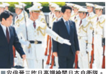
■安倍晉三昨日高調檢閱日本自衛隊。

北京學者警告說，安倍政府加速右傾將會把日本引向危險邊緣。 學者：將日引向危險邊緣 據共同社報道，安倍昨日上午召集自衛隊軍官在防衛省開會並進行訓話，稱「將繼續爭取符合21世紀國際形勢的國家地位」，表示會積極討論允許行使集體自衛權的相關問題。共同社稱，安倍指將推進直面現實的安保體制改革，不能「讓第一線的自衛隊員承擔不良後果」。 據鳳凰衛視報道，安倍在演講中提到東海以及海洋的航行自由和日本領土安全，要修改安保政策，創立日本版的國家安保會議，並探討行使集體自衛權。他在訓話中雖沒直接提中國，但其實核心內容就是要應對「中國威脅」，因此刻意強調日本面臨非常嚴峻的國家安全全局勢。