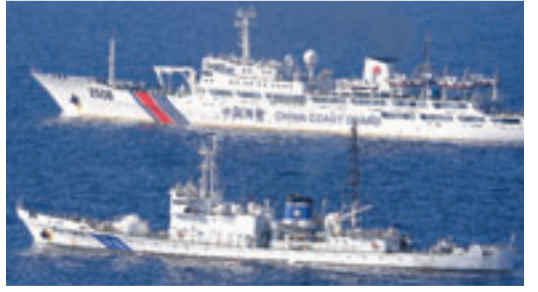
■中國海警船11日在釣魚島海域巡航時，被日本巡邏船一對一緊盯。

香港文匯報訊 據新華社報道，中共中央政治局委員、中央軍委副主席范長龍近日在海軍部隊調研時指出，要着眼應對複雜困難局面，緊緊抓住突出問題和短板弱項，加速推進海上軍事鬥爭各項準備，全面提高我軍信息化條件下海上威懾和實戰能力，確保一聲令下召之即來、來之能戰、戰之必勝，有效維護國家主權、安全和發展利益。