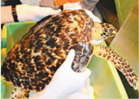
■海龜玳瑁海園觀察期間死去。

香港文匯報訊（記者 杜法祖）早前獲善心酒家東主買下，而逃過被烹煮厄運的極度瀕危海龜玳瑁，日前卻在海洋公園觀察期間死去。海洋公園表示，初步解剖發現吞下金屬魚鈎玳瑁曾患有胃腸炎，將進一步分析研究其死因。