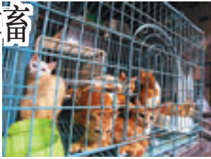
■愛協將部分健康有問題貓隻帶走。

香港文匯報訊（記者 杜法祖）油塘邨華塘樓一單位，昨午4時許，警方接獲管理員報案指單位傳出臭味，警員入屋調查，發現同一個鐵籠內擠有逾十隻貓，亦有部分貓住可以在屋頂，在愛護動物協會人員到場勘查，發覺有逾50隻貓，其中有些更患有皮膚病，但就缺水缺糧。及至晚上，愛協