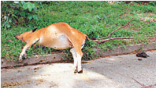
■在嶼南路疑遭車輛撞死的1歲大牛女。

另外於昨晨10時，正當警方與漁護署調查牛女被撞死案期間，附近塘福亦發現另一隻右前蹄受傷雌性牛牛，惟漁護署獸醫到場檢查後，認為水牛右前蹄發炎，須人道毀滅，經義工再三交涉並