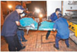
■夫婦雙屍由件工昇離現場。

香港文匯報訊（記者 杜法祖）將軍澳彩明苑前晚揭發倫常慘劇，一對平日表現恩愛夫妻，被夜歸女兒發現分別身中多刀及吊頸死亡，警方調查後不排除是患「妄想被迫害症」丈夫以菜刀斬死妻子後畏罪上吊自盡，正調查慘劇起因，包括是否有人病發或爭執失控引致，案件列作「兇殺及自殺」處理，2名死者家人昨晨往殮房認屍後，神情哀傷。有區議員指區內支援問題家庭的配套不足，建議政府檢討。