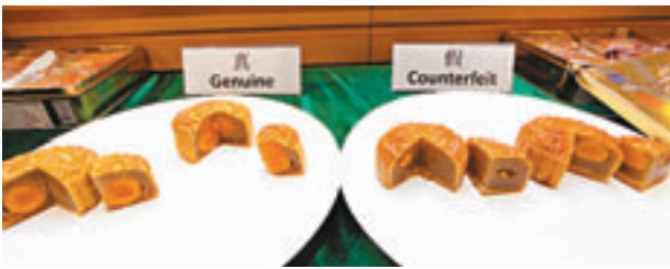
■真假恆香雙蓮蓉月餅被切開之分別。

海關正設法追查該批冒牌月餅是從何種途徑運入本港，以及在內地是否被大量生產等。根據本港商品說明條例，任何人管有應用偽造商標的物品作出售用途，均屬違法，一經定罪，最高可判處罰款50萬元及監禁5年。