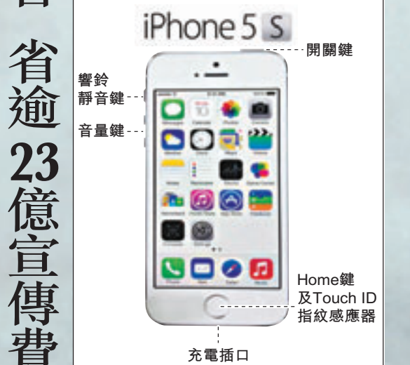
■網上流傳的iPhone 5S操作指南。網上圖片