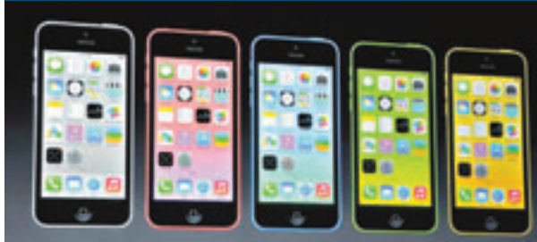
■iPhone 5C的5種色系。網上圖片

蘋果公司於香港時間今日凌晨1時舉行發布會，公布新一代iPhone 5S及低階版iPhone 5C，並一改過往新機出舊機減價的傳統，宣布上一代iPhone 5將會停售。其中5S同時提供銀、金及「太空灰」三色可供選擇，兩款新機都將於13日起開放預訂，20日正式開售，首發地區破天荒包括中國內地及香港。