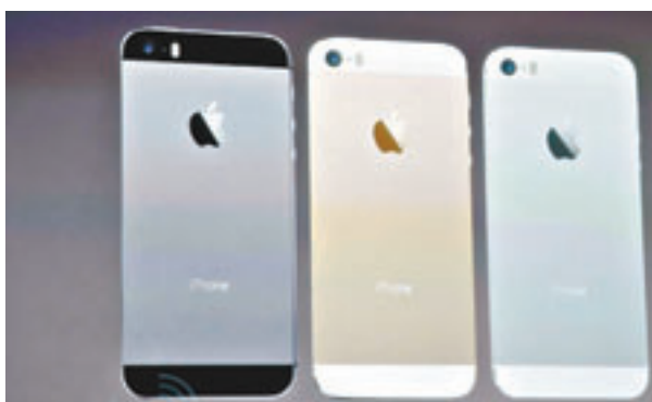
■iPhone 5S推出3種色系，分別為銀、金及「太空灰」。