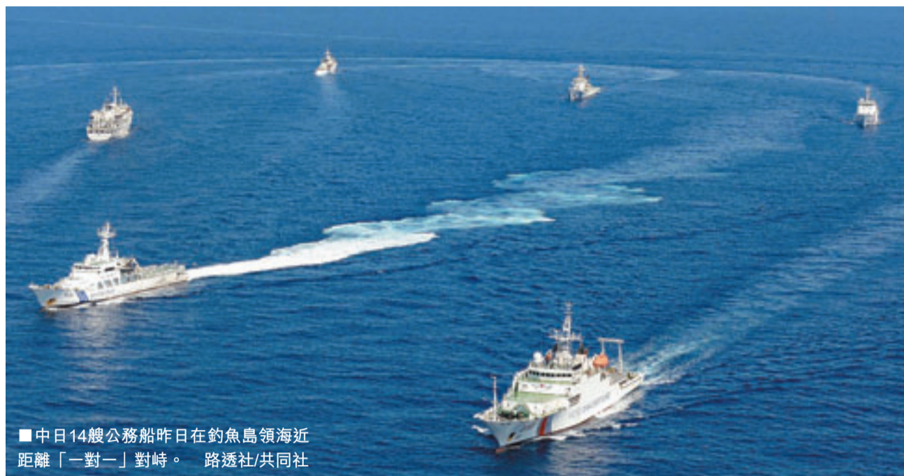
■中日14艘公務船昨日在釣魚島領海附近距離「一對一」對峙。

香港文匯報訊（記者 葛沖 北京報導）今日是日本所謂「購買」釣島（「國有化」）一周年，中國海洋局昨日派出7艘海警艦船組成的編隊赴釣魚島領海內維權巡航，日本海上保安廳派出7艘艦艇尾隨監視，但被中國海警艦船要求立即離開中國領海，雙方一度對峙。中國海洋局強調，今後中國將不斷推進釣魚島維權執法，以實際行動維護中華民族的領土主權和海洋權益。對於日方昨日聲稱擬在釣島派駐公務員，中國外交部表示，不容忍日方採取侵犯中國領土主權的升級行動。