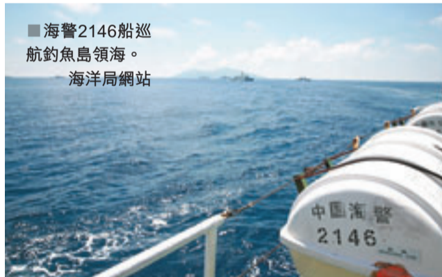
■海警2146船巡航釣魚島領海。海洋局網站