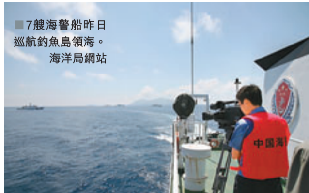
■7艘海警船昨日巡航釣魚島領海。海洋局網站