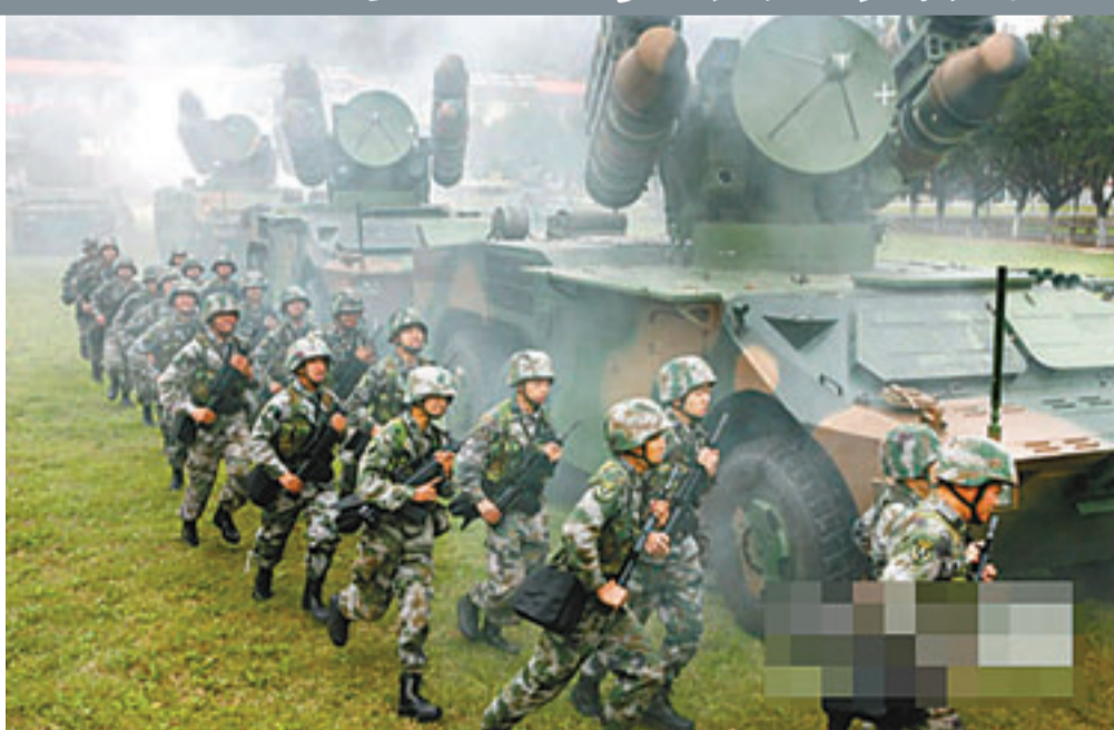
■31集團軍官兵迅速進入演習狀態。

演習過程中，南京、廣州軍區參演部隊將以摩托化、鐵路、海上、空中輸送相結合的方式組織遠程機動，並展開防偵察、防空襲、防干擾和反襲擾等演練；空軍參演部隊主要將以地面和空中輸送相結合的方式組織遠程奔襲，並開展紅藍空中攻防對抗演練。演習還將動員鐵路、公路和民航飛機、民用船隻參與輸送兵力和武器裝備。