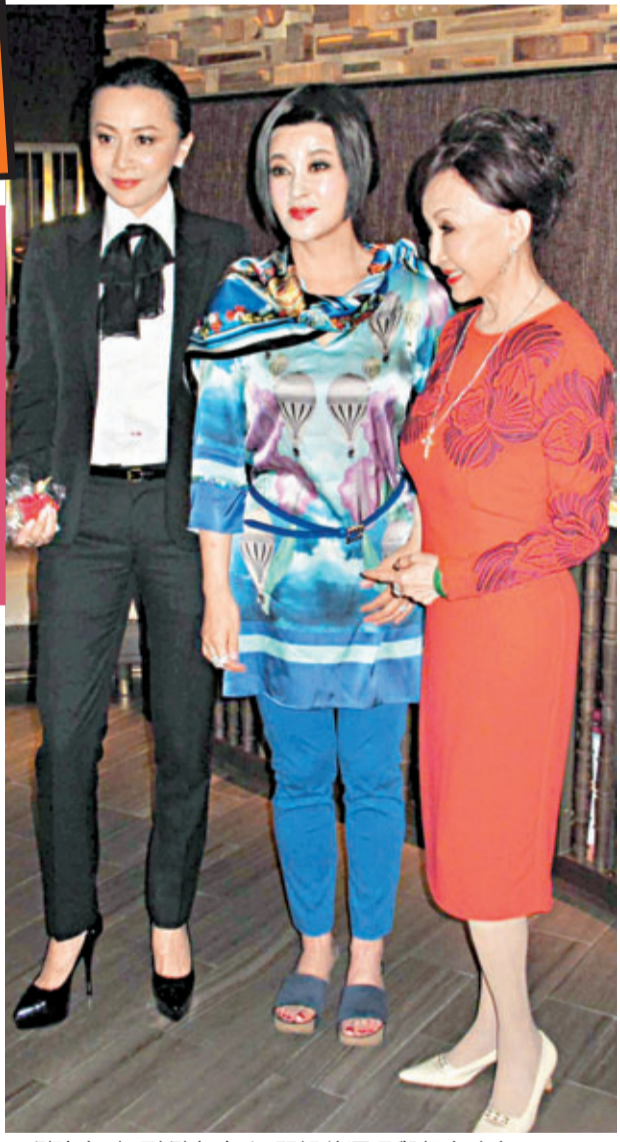
劉曉慶(中)到劉嘉玲(左)開設的酒吧舉行慶功宴。