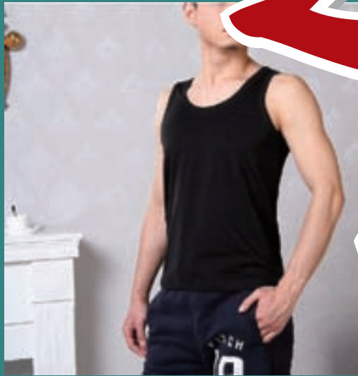
■上海夢騰工貿有限公司男士內衣成衣