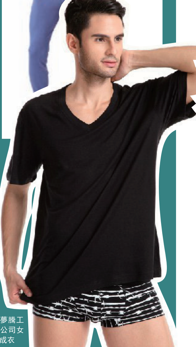
■上海夢騰工貿有限公司女士內衣成衣