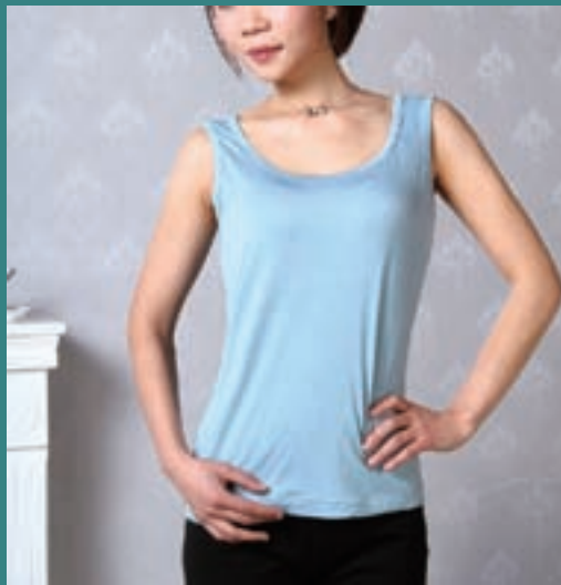
■上海夢騰工貿有限公司女士內衣成衣