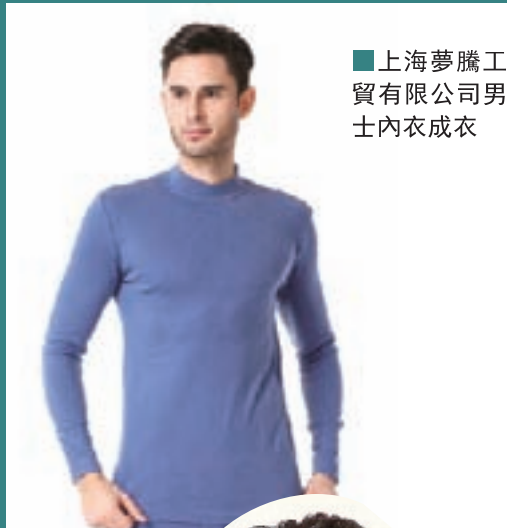
■上海夢騰工貿有限公司男士內衣成衣