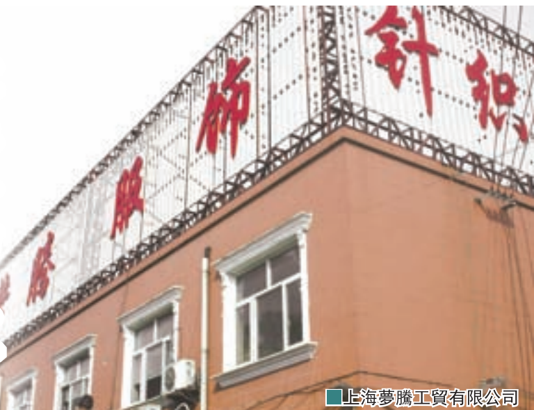
■上海夢騰工貿有限公司

上海夢騰工貿有限公司成立於二十世紀，是一家近二十年之久、頗有誠信度和知名度的內地獨資企業。該公司位於上海大虹橋樞紐，擁有三大品牌「LIKOCI HOME、仟姿嘜和夢騰」，經營範圍不僅有針紡織品、百貨商業、工藝美術品，而且有金屬材料、五金交電、橡膠製品、通信設備、電子產品和電腦等。現有廠房5000平方米，員工380多人，年銷售量上億元。