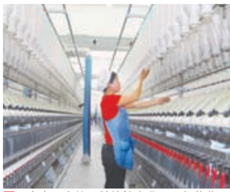
■河南省最大的民營棉紡企業——銀龍集團