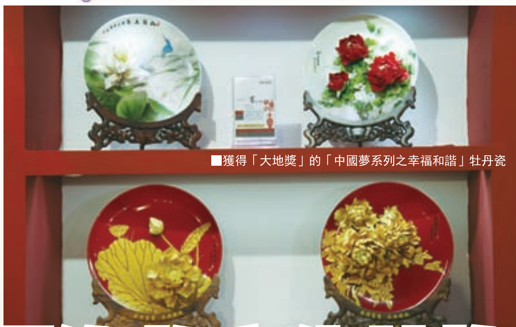
■獲得「大地獎」的「中國夢系列之幸福和諧」牡丹瓷

在他身上，我們感受到了河南人堅毅、執著、善學、認真、迎接挑戰的性格。相信他一定會有更大的成功，他的牡丹瓷事業之路會越走越廣闊，並將這一新的歷史文化符號傳承下去，留給歷史。