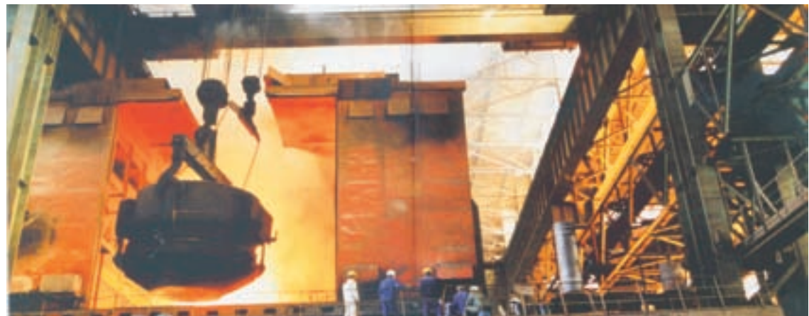
■舞鋼公司，是中國特寬厚鋼板生產科研基地

科研基地，中加鋼鐵公司、銀龍集團是河南省最大的民營鋼鐵、紡織企業，舞陽礦業公司等企業實力雄厚，全市已形成了「鋼」一「柔」優勢互補的產業發展體系。四是古老而又年輕。這裡春秋時為柏子國，戰國時屬韓，自古為冶鐵重地，以生產利劍而聞名，龍泉、合伯寶劍即產於此，冶鐵文化在中國乃至世界冶鐵史上都佔有重要的地位。2010年4月舞鋼市正式被國家民協命名為「中國冶鐵文化之都」。說它年輕是因為舞鋼建市僅僅23周年，獨立建制才43年時間，包容性和創新意識強，發展環境優越，是一座充滿生機與活力的新興城市。