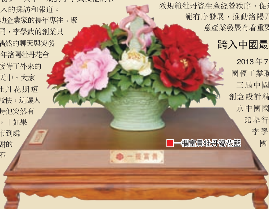
■一欄富貴牡丹瓷花瓶

與此同時，李學武還積極開發歷史文化與現代藝術有機融合的特色文化旅遊商品，先後推出了「北京禮物」系列，「龍門石窟」系列、「問禮洛陽 禮行天下」系列產品，並在北京、洛陽、鄭州等地開設多家李學武牡丹瓷藝術館，以藝術禮品的形式來弘揚和傳播河洛文化。