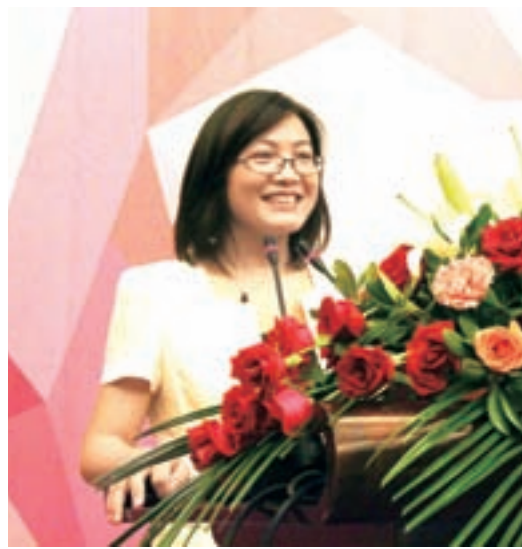
■江西共青城市市長盧實雲在3D產業論壇致辭。