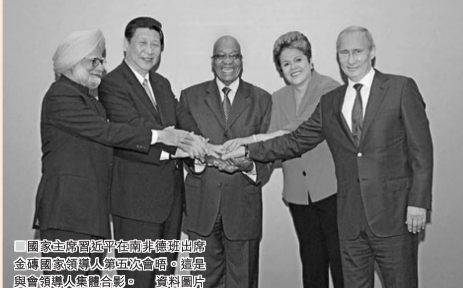
國家主席習近平在南非德班出席金磚國家領導人第五次會晤。這是與會領導人集體合影。 資料圖片