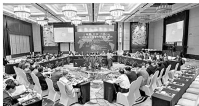
2012年金磚國家智庫論壇在重慶開幕。

中國與其他金磚國家均保持良好的政治合作關係。在政治合作領域中，中國處於核心位置。中俄互為最主要、最重要的戰略協作夥伴。兩國的積極合作能夠在世界舞台上更好地維護「金磚國家」利益。在2008年金融危機之後，中印積極展開政治經濟合作，對亞洲局勢有着重要的影響力。同時，中國與巴西也保持了良好的關係。習近平指出：「當前，中巴關係正處於歷史最好水準，戰略性和全局性日益凸顯，兩國發展利益從未像今天這樣緊密相連。」此外，中國與南非的關係也實現了從夥伴關係到全面戰略夥伴關係的歷史性跨越。