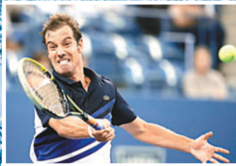
■加斯蓋特未能威脅拿度。