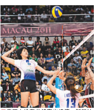
■泰國女排奪世錦賽出線權。新華社