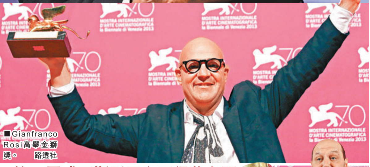
■Gianfranco Rosi 高舉金獅獎。