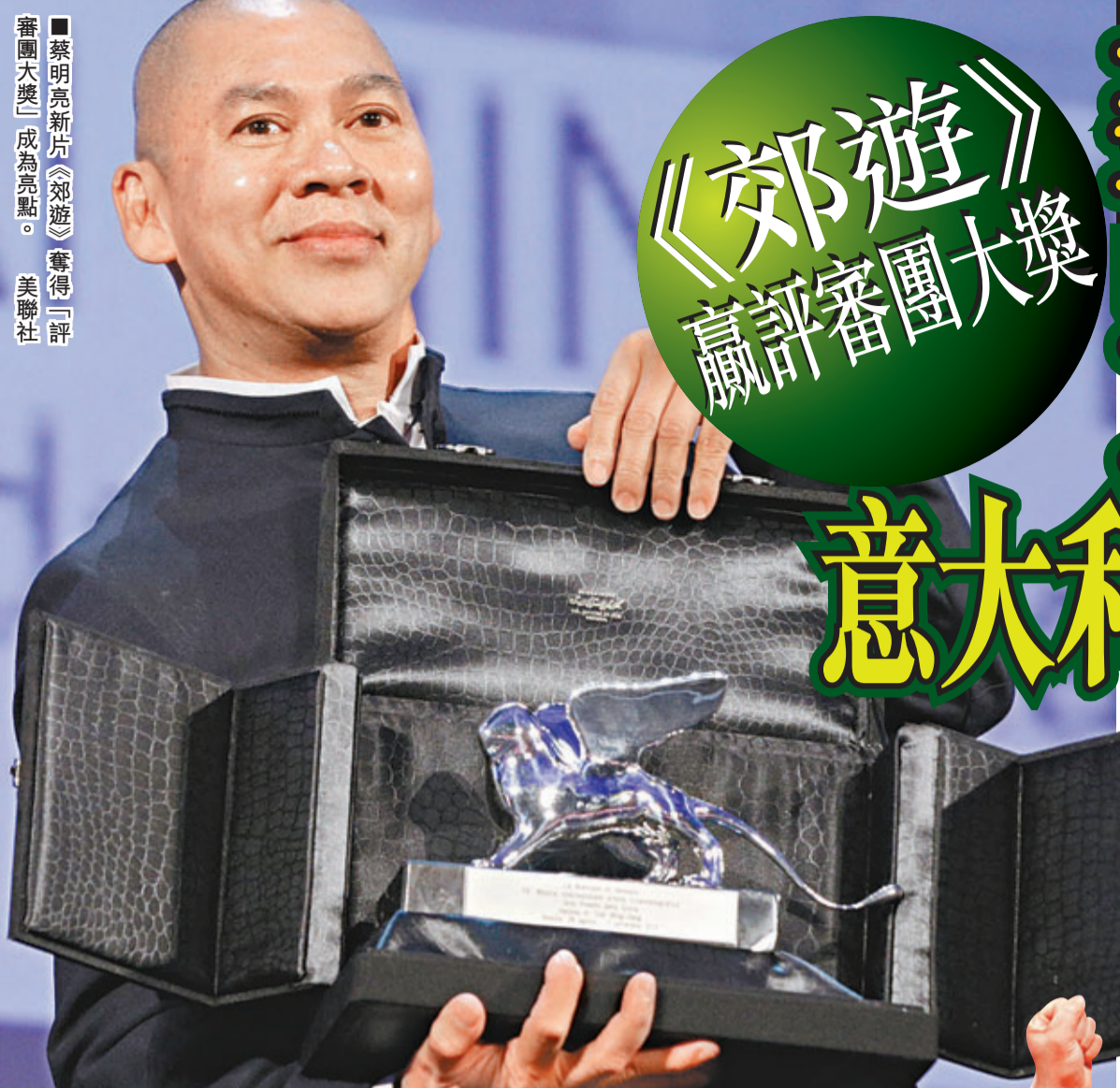
■蔡明亮新片《郊遊》奪得「評審團大獎」成為高點。