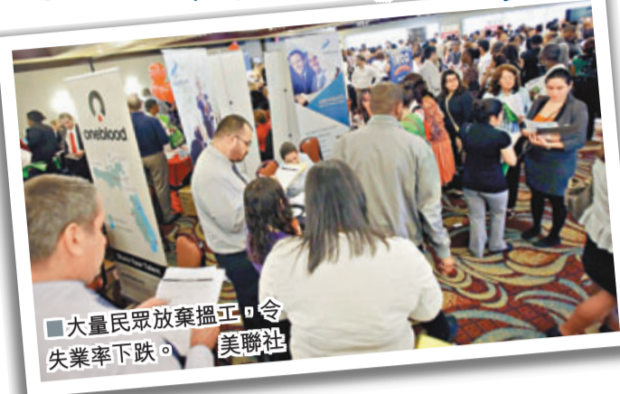
大量民眾放棄搵工，令失業率下跌。

美國上月就業報告日前出爐，料成為聯儲局下周議息時制訂退市策略的重要數據。分析指，雖然美國已連續35個月維持增加職位，但在今年新增的144萬個職位中，分別有45%和60%是低層職位和兼職，加上失業率跌至7.3%的4年半低位，很大程度是因為大量民眾放棄搵工。報道批評，第三輪量化寬鬆(QE3)無法創造充足的經濟增長和職位。