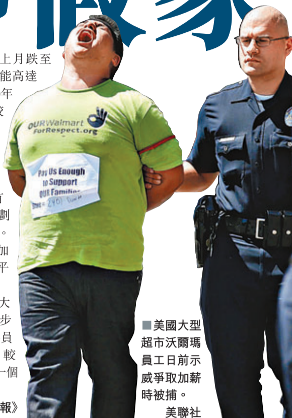
美國大型超市沃爾瑪員工日前示威爭取加薪時被捕。