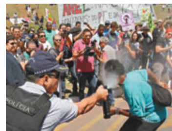
警員向示威人士近距離噴胡椒噴霧。