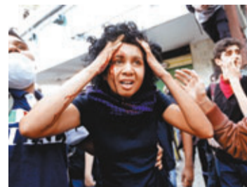
有女子受傷，血流披面。

前日是巴西獨立日，多個城市有反政府貪污示威，並要求改善衛生、交通、教育和治安，但規模不及6月洲際國家盃期間反對巴士及地鐵加價的示威。警方發射胡椒噴霧及橡膠子彈控制場面，多人被捕。