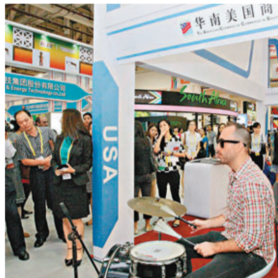
鄉村民謠為美國館聚集人氣。