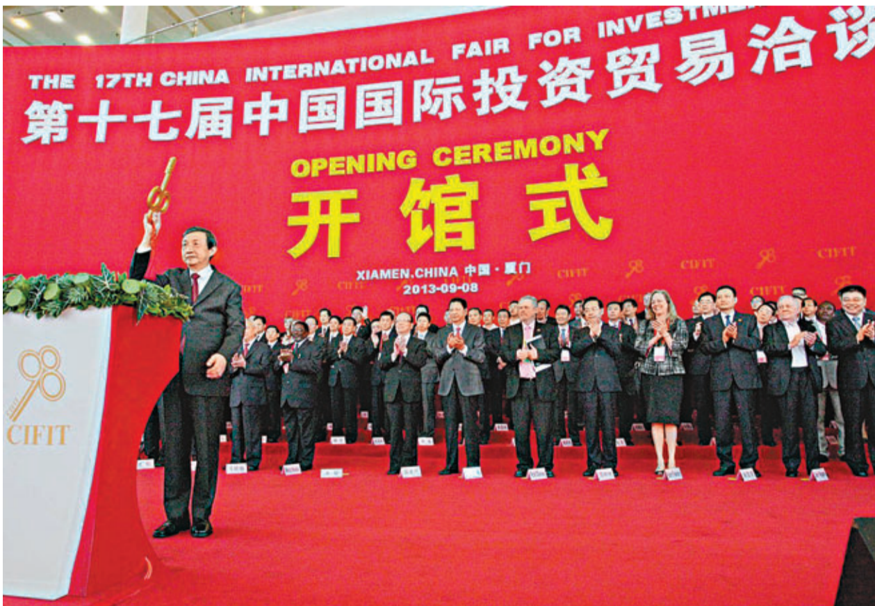
國務院副總理馬凱為17屆投洽會開館式啟動金鑰匙。