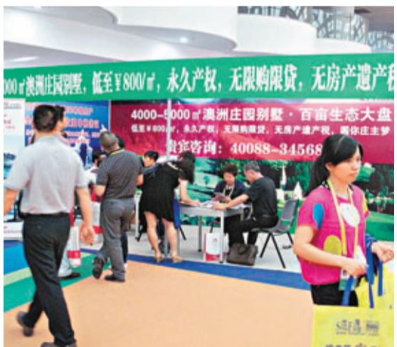
地交會展位前的諮詢人流絡繹不絕。

香港文匯報訊(記者 陳艷芳 廈門報道) 中國房地產網頁居外網(Juwai)中國區經理葛奕婕在廈門舉行的第五屆中國國際地產投資交易會(下稱「地交會」)上為澳洲客戶尋找中國合夥人。逐年擴容的展館裡,海外地產投資展位一字排開,其間人流甚至超過中國國內各大地產商更為精緻的展位。