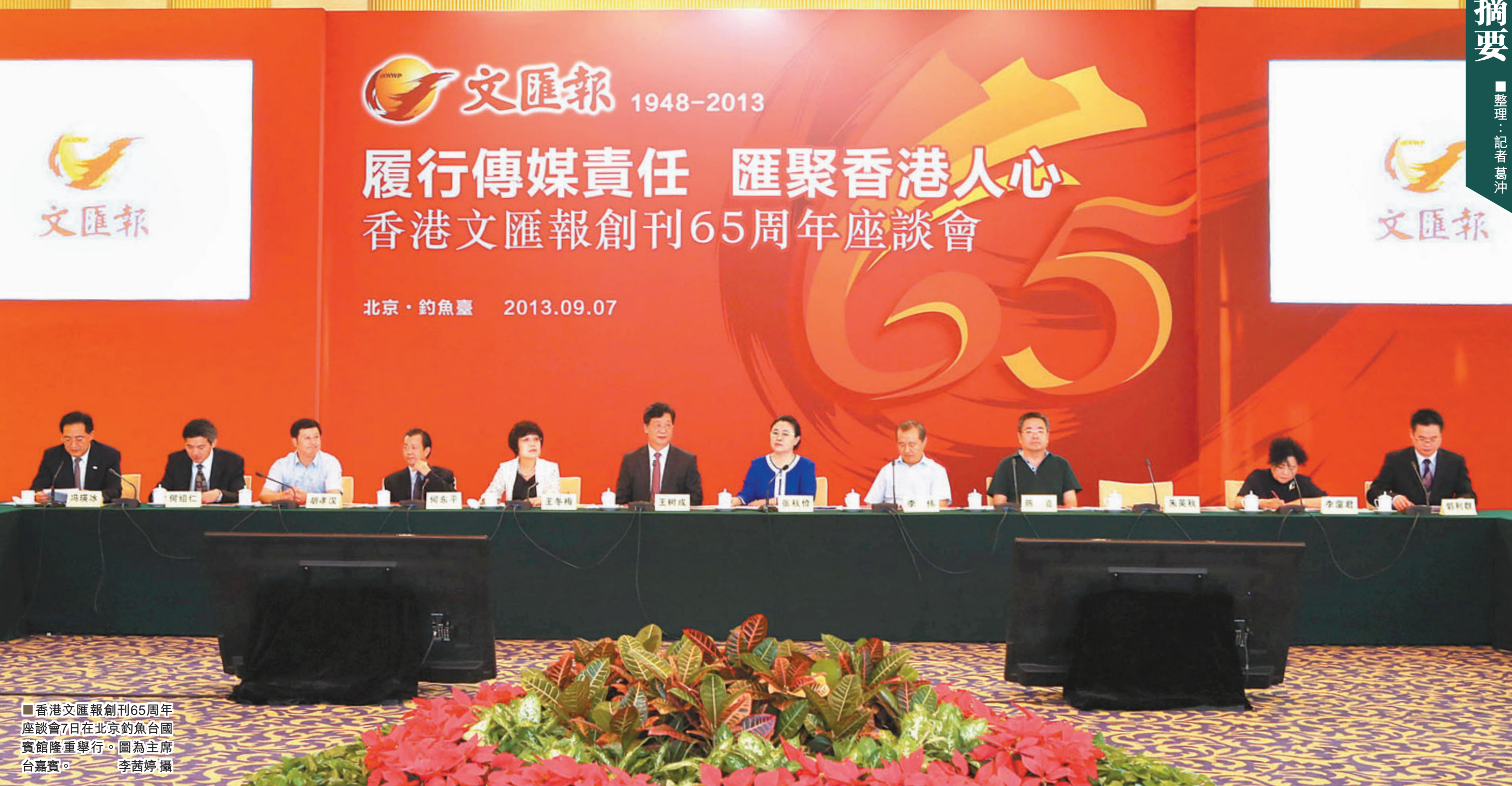
香港文匯報創刊65周年座談會7日在北京釣魚台國賓館隆重舉行。圖為主席台嘉賓。