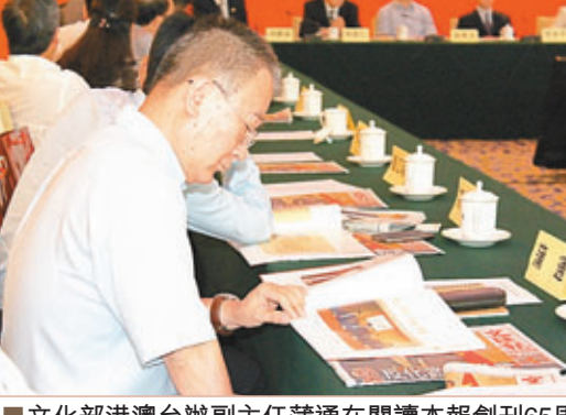
文化部長港澳辦副主任蒲潤在閱讀本報創刊65周年紀念畫冊。

釣魚台5號樓華燈璀璨,紅色調的背景板洋溢著喜慶氣氛,「65」的數字格外奪目。「履行傳媒責任,匯聚香港人心——香港《文匯報》創刊65周年座談會」在這裡隆重舉行。除張亞雄