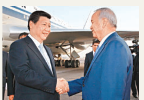
習近平抵達塔什干，烏茲別克斯坦總統卡里莫夫到機場迎接。

香港文匯報訊 據中國日報網消息：繼7日密集的訪問日程後，中哈元首8日同乘專機移師哈經濟文化中心阿拉木圖。機上兩國領導人共進早餐，家常鹹菜加小米粥吃出親切；飯後就著一杯清茶，暢談國事，意氣相投。納扎爾巴耶夫表示：「我一上飛機，就有一種賓至如歸，回到中國的感覺。」