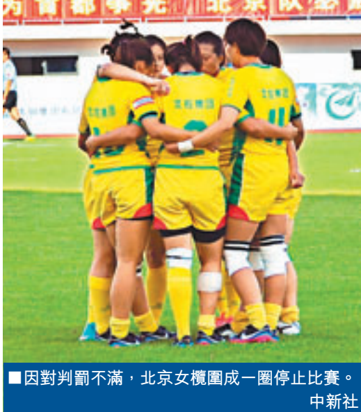
■因對判罰不滿，北京女欖團成一團停止比賽。

在3日全運會女子橄欖球決賽中，北京隊在0：15落後山東隊後罷賽，隊伍在場地靜站，山東隊以令人矚目的71：0獲勝。