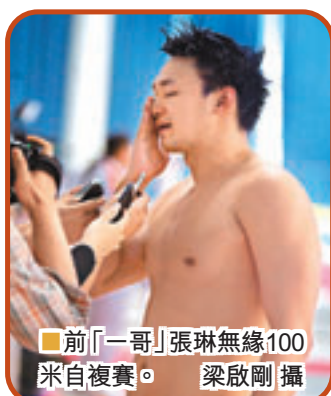
■前「一哥」張琳無緣100米自複賽。

翻開他的功績簿，曾在2008年北京奧運會男子400米自由泳項目獲得銀牌，又在2009年羅馬世錦賽男子800米自由泳的比賽中為中國男子游泳獲得首枚金牌，對此孫楊說，「張琳為中國男子游泳保留了顏面。」 不過，張琳否認將在本屆全運會後退役，他的設想是出國深造，以邊讀書邊比賽的方式延續運動生涯。「退役對每個運動員來說都是正常的過程，」他說：「堅持了這麼多年，對游泳還是很濃厚的感情。我所有的一切基本上都是游泳帶來的。以後不管還幹不幹游泳，都會想念這個賽場。」