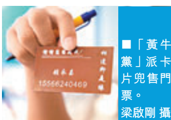
■「黃牛黨」派卡片兜售門票。

據小記了解，游泳比賽開始前，遼寧省體育局瀋陽訓練基地游泳館外的售票亭門口，圍着不少要買票的市民，他們都是衝着中國游泳名將孫楊而來。「游泳票還有嗎？」、「游泳票怎麼賣？」詢問的市民絡繹不絕。但工作人員表示，當天的門票早在中午之前就已經全賣完了。 不過，在游泳館周邊就不斷有「黃牛黨」搭訕；觀眾想看一眼孫楊也不容易，游泳門票起價是300元人民幣，而要想從他們手中買到一張決賽門票，至少得付