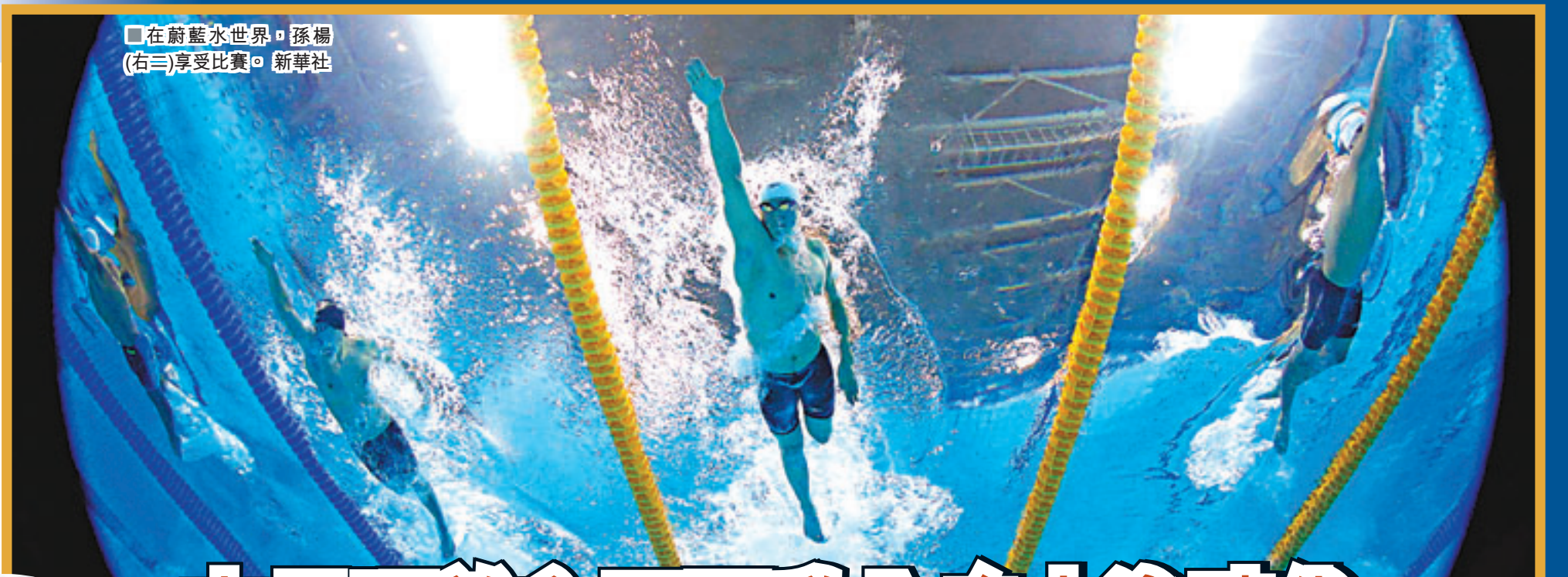
■在蔚藍水世界，孫楊(右三)享受比賽。新華社