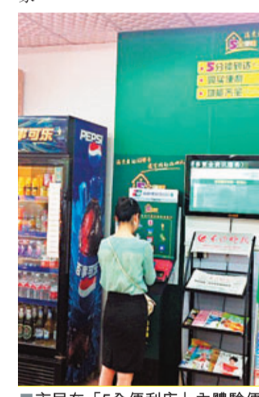
市民在「5全便利店」內體驗便民服務。

據悉,市民在「5全便利店」可額外享受10大類、18項服務功能。具體來說,通過銀聯多媒體POS機,市民可體驗繳納水費、電費、燃氣費、有線電視費、信用卡還款等服務。而通過多媒體終端,市民可實現航空機票訂購,郵件收寄、轉投,報刊訂閱,獲取家政服務、旅遊資訊、廢舊物品回收信息等。據市商務局副局長王紅介紹,這些服務在便民店的集成綜合提供是全國首