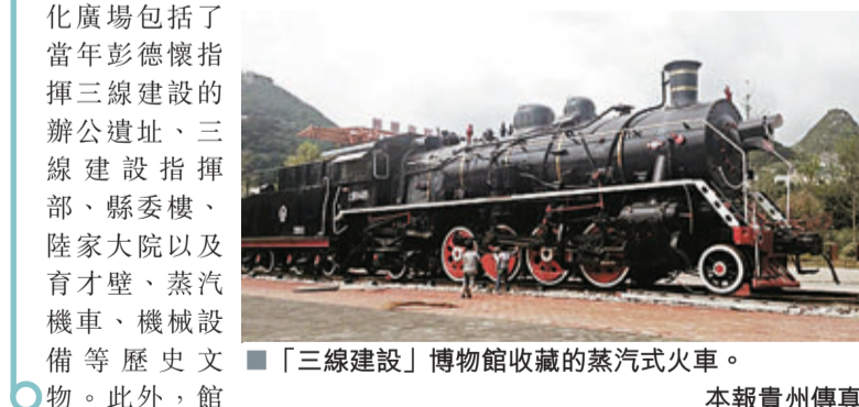
「三線建設」博物館收藏的蒸汽式火車。本報貴州傳真

香港文匯報訊(記者 虎靜 貴陽報導)8月17日,內地首家以「三線建設」為主題的博物館在貴州省六盤水市正式開館,該博物館將通過微縮場景再現三線建設時期的生產生活場景。據了解,該博物館分有室內場館和室外文化廣場兩個區域,文化廣場包括了當年彭德懷指揮三線建設的辦公遺址、三線建設指揮部、縣委樓、陸家大院以及育才壁、蒸汽機車、機械設備等歷史文物。此外,館內還收藏了大量三線建設時期極具代表性的生產工具、生活用品以及歷史文獻、圖片等。