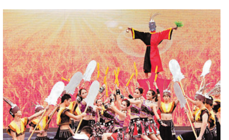
廣西隆安歌舞 9月5日,2013年南寧國際民歌藝術節「綠城歌台」隆安歌台暨中國、隆安「那」文化旅遊節在隆安縣開幕。在「中國那文化之鄉」廣西南寧市隆安縣,民間藝人表演特色民俗歌舞節目,展示壯族稻作文化。

香港文匯報訊(記者 孫菲 哈爾濱報導)近日,一輛「寵物急救車」亮相哈爾濱市街頭,吸引了眾多目光。車上標有貓狗、寵物字樣,被看見的市民稱作「貓狗120」。據了解,該「寵物急救車」為哈爾濱市一家寵物醫院所有。車體由價值20餘萬元的福特商務車改裝,車內配有寵物急救箱、麻醉、止痛等藥品,以及寵物固定裝置和病床。同時,隨車配有兩名專業的寵物醫生。