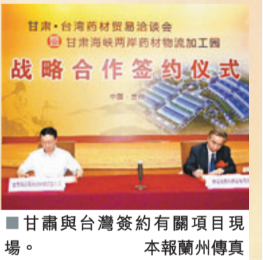
甘肅與台灣簽約有關項目現場。

甘肅是全國中藥材優勢主產區之一,人工種植面積位居全國第一位。此次貿易洽談會邀請了台灣中藥商同業公會客商21人,先後赴甘肅武威、白銀、定西等中藥材主產區進行實地考察。目前,已有三家台灣客商已就入駐甘肅海峽兩岸藥材物流加工園簽約。