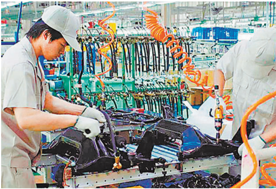
浙江省是中小微企業的大省,佔企業總數九成七之多。

香港文匯報訊(實習記者 王菁 杭州報導)5日從浙江省政府舉辦的新聞發佈會上獲悉,浙江率先在全國出臺並實施小微企業升級轉型為規模以上企業的政策,以現有年主營業務收入500萬至2000萬規模以下的小微企業為重點,通過培育扶持、改造提升,實現3年培育一萬家「小升規」企業的目標。