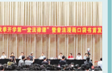
河南高院舉行普法漫畫口袋書首發儀式。本報河南傳真

「不僅要讓我們的孩子學知識,也要讓孩子們學法律。」河南高院院長張立勇以「南召縣李孝良性侵犯4名幼女案」舉例表示,今後法院的「法制進課堂」「一校一法官」等活動,要向「移民學校」「留守兒童比較多的學校」及「邊緣山區學校」等重點地區轉移。「開車前不管是司機還是乘坐人,都要繫安全帶,這就是法。應該從點點滴滴看一個法治國家的文明度。」河南省委宣傳部副部長朱夏炎在活動上稱,普法教育很重要,不僅是法院的事,也是全民的事。