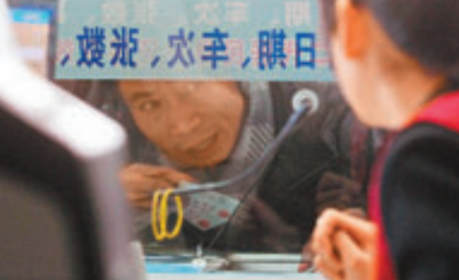
■存儲指紋的二代身份證令市民的行蹤暴露。圖為市民手持身份證購買車票。

有犯罪者可能利用買回來的身份證，冒充別人身份，作為乘車、租住旅舍等用途，逃避追捕。這增加警方破案的難度。若身份證加入更多識別措施，如指紋，會令疑犯更難隱藏身份。