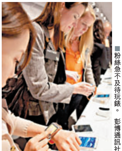
粉絲急不及待玩錶。

Galaxy Gear內置聲控鏡頭，令外界擔憂會被不法分子用作偷拍。據悉三星考慮此情況後，已設定手錶在拍攝時無法關閉操作聲音。