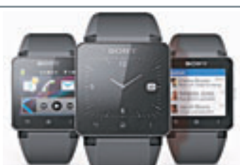
■Sony Smart Watch 2