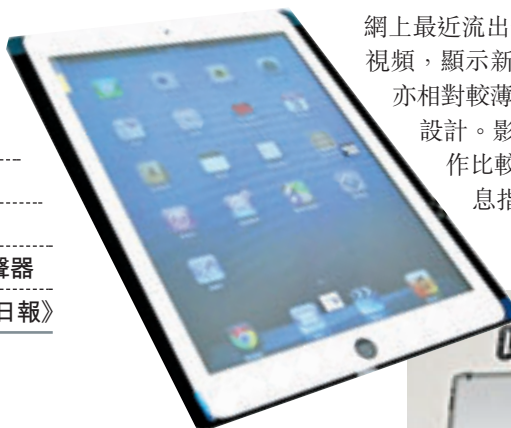
■iPad5較舊機窄1.5厘米，亦相對較薄。 網上圖片