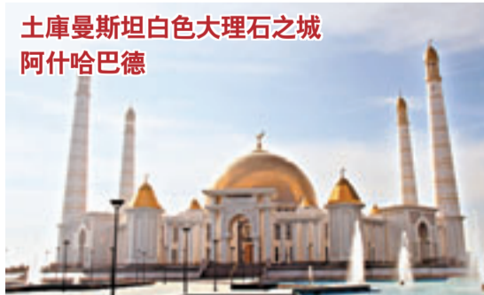
土庫曼斯坦白色大理石之城 阿什哈巴德