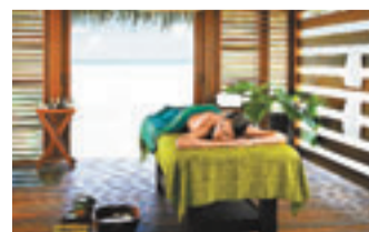
在海上的茅草閣享受按摩，感覺與天海更貼近。

位於斯里蘭卡以南印度洋的馬爾代夫群島，由於地貌得天獨厚，素有人間天堂的美譽。四季酒店集團在馬爾代夫開設了兩間分店，喜歡小巧幽靜的，可以選擇距離馬爾代夫機場只需25分鐘船程的四季庫達呼拉島(Four Seasons Resort Maldives at Kuda Huraa)。