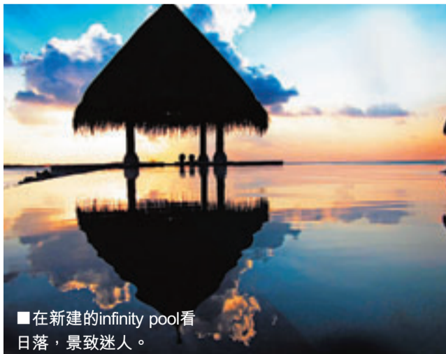
在新建的infinity pool看日落，景致迷人。