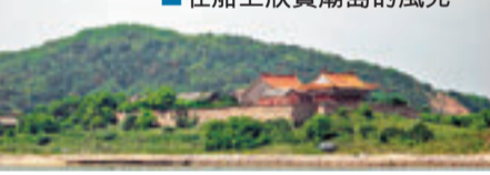
在船上欣賞廟島的風光