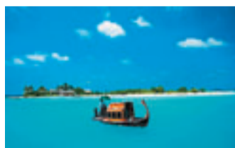
這便是載我去Island Spa的多尼船。