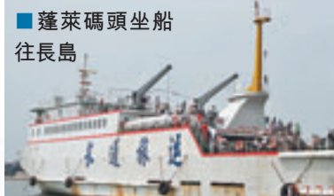
蓬萊碼頭坐船往長島