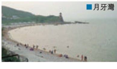
岩灘上，滿佈帳篷，大家非常寫意。