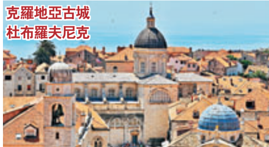
克羅地亞古城 杜布羅夫尼克