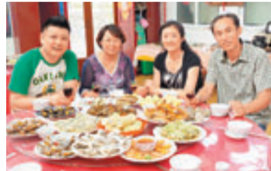
你看！滿桌都是海鮮，很吸引！

在長島，由於四面環海，島上海鮮肥美，如大螃蟹、長爬蝦、海蜆子、海膽、鮑魚、海參，還有從漁家大嫂手裡加工出的鱈魚餃子、玉米餅子等。位於明珠廣場東部的海鮮大排檔，依山傍海，環境優雅，以海鮮為主的各種燒烤和特色小吃為主。長島的酒店，大部分緊鄰大海，無論是黎明還是傍晚，總能從寬闊的窗格裡看到海面的陽光。