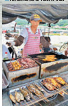
廟島處處都是燒海鮮

然後，你會看到島上有廟宇，這就是廟島，你可下船參觀。島上有座千年媽祖廟，你可領略媽祖護海的神奇魅力，親身體驗顯應宮890年的歷史文化積澱。廟島始建於北宋宣和四年（公元1122年），是中國北方修建最早、規模最大、影響最廣的媽祖廟，也是世界重要的媽祖官廟之一，享「天妃北庭」、「北海神鄉」之美譽。