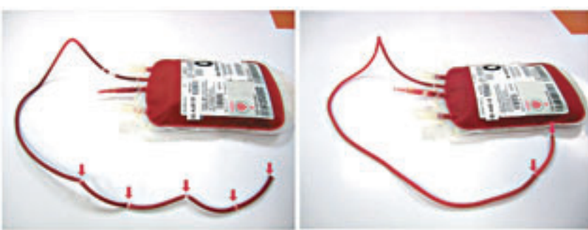
香港紅十字會輸血服務中心已即時採取措施,減少醫院血庫需處理血色喉管的程序。血包喉管會增加預製分段以方便配血(左圖),右圖為原來只有一截預製分段。

香港大學李嘉誠醫學院微生物學系講座教授袁國勇教授曾獲邀協助檢視今次個案,他指出雖然現時無法確定螢光假單胞菌進入血包的原因,但推斷是這種細菌經過連繫血包的軟管上的一些非肉眼所能看到的微細裂縫,進入血包內。此外,血包如果從血液儲存櫃(溫度為攝氏4度)取出放置於室溫,10分鐘後血包表面會有冷凝水形成,因而增加細菌經過微細裂縫進入血包的潛藏風險。他強烈建議醫院血庫盡