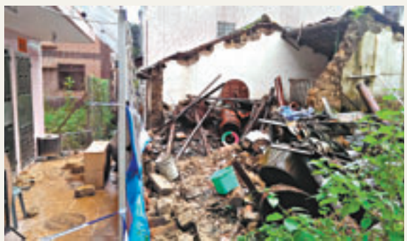
西沙路峯下村一空置村屋在黃雨期間倒塌。

香港文匯報訊(記者 杜法祖)本港昨晨受一道低壓槽影響出現不穩定天氣,廣泛地區錄得超過50毫米雨量,其中新界北區更在1小時內錄得近100毫米雨量,天文台一度發出長達3個半小時的黃色暴雨警告,粉嶺及沙頭角均出現水浸,長洲及馬鞍山分別發生山泥傾瀉和村屋外牆倒塌,幸未釀成傷亡。天文台預測今日仍然有雨,隨後兩三日漸轉天晴。