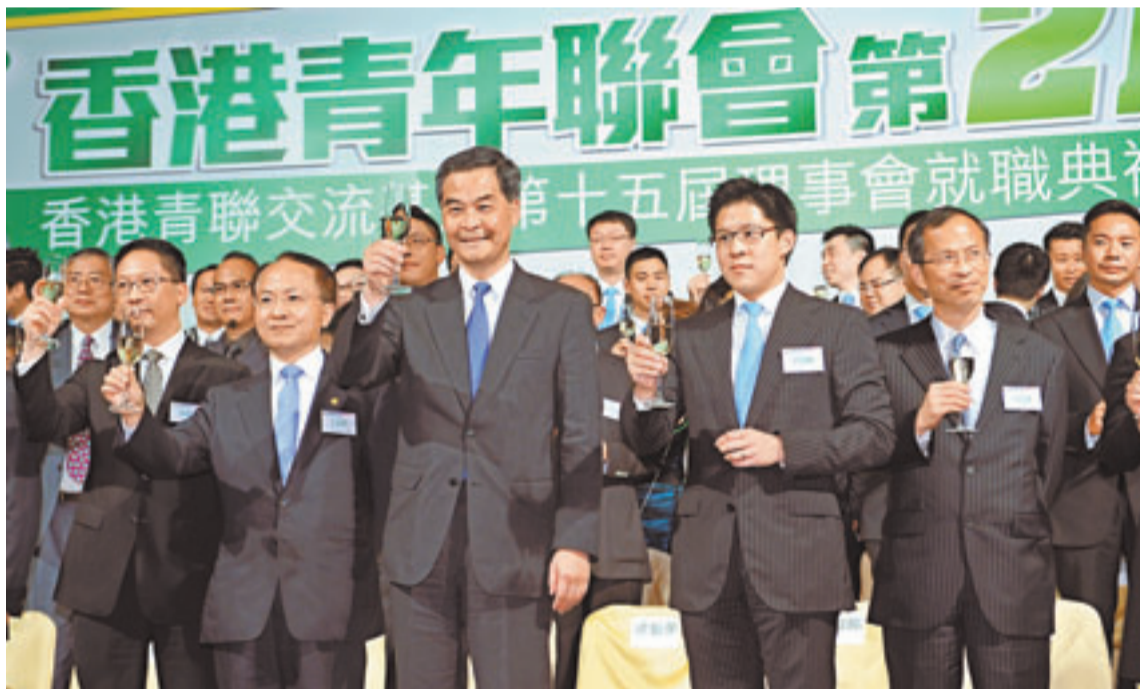
■梁振英與王志民出席香港青年聯會國慶酒會祝酒儀式。

香港文匯報訊（記者 鄭治祖）中共中央政治局常委、全國人大常委會委員長張德江日前會見香港紀律部隊代表團時表示，中央政府滿意、支持特首梁振英施政，並強調發展經濟、改善民生，進行政改、推進民主都要講法治。中聯辦副主任王志民昨日表示，中央政府滿意梁振英及特區政府管治團隊的工作，又強調法治和穩定是香港繁榮發展和人民幸福生活的前提和基礎，青少年有責任珍惜和維護香港法治和穩定，反對及防範出現破壞踐踏法治的亂象和惡果。