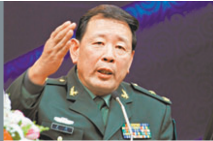
解放軍少將、中國戰略文化促進會常務副會長羅援 資料圖片

香港文匯報訊 據中通社報導，第七屆兩岸發展論壇於8月31日至9月1日在浙江大學舉行，在關於兩岸軍事互信的小組討論上，解放軍少將、中國戰略文化促進會常務副會長羅援呼籲，兩岸軍事互信雷聲大雨點小，現在應該下點「及時雨」，才能為兩岸關係注入新動力。羅援指出，從國共兩黨的幾次合作來看，如果要形成合作，必須要有共同的壓力，有了共同的壓力，才有共同的動力，進而才會形成激勵。