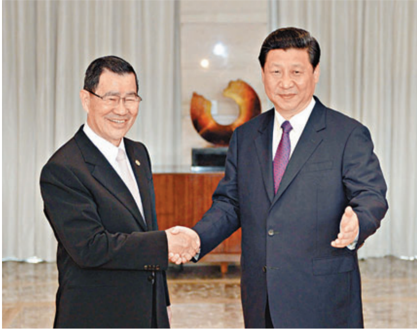
蕭萬長與習近平將於10月在印尼舉行的APEC上會面。圖為二人在4月的海南博覽亞洲論壇上會面。

台灣正全力推動自由經濟示範區，這是「馬政府」當前重要的經濟政策之一。蕭萬長此行肩負重要任務，