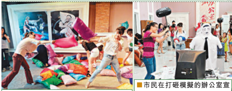
眾多女士進行瘋狂的枕頭大戰。 中新社

長沙世界之窗昨日舉辦減壓節，吸引眾多市民來到城內進行砸辦公室、枕頭大戰、打「老闆」、尖叫喇叭等減壓活動。據主辦方介紹，平日的工作和學習壓力讓眾多市民感覺神經衰弱，卻無法發洩。公園精心設計的快樂減壓法組合，可以讓市民身心得以充足的放鬆。 中新社