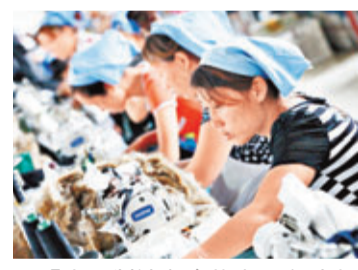
「中國製造」合格率20年來提升了近20個百分點。圖為內地一家製衣廠車間。 資料圖片

香港文匯報訊 據新華網報道，國家質檢總局副局長梅克保昨日說，國家監督抽查平均合格率從1993年的70.4%提高到去年的89.8%，提升了近20個百分點。梅克保是在1日舉行的《中華人民共和國產品質量法》施行20周年座談會上作此表述的。20年來，國家監督抽查累計抽查覆蓋了日用消費品、家用電器、工業生產資料、農業生產資料、建築及裝飾裝修材料等500多種產品。他同時透露，僅2012年，質監系統就查處了產品質量違法案件17萬起，涉案貨值高達68億元，有力維護了消費者權益，規範了市場秩序。