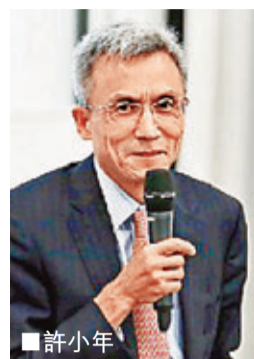
香港文匯報訊 據中新財經報道，經濟學家許小年1日在廣州出席了「第二屆全球浙商高峰論壇」時談及當前中國經濟形勢，他指出，政府應啟動新一輪

改革開放，創造更多的投資機會，依靠企業和個人的活力創造財富，支撐中國的經濟增長。許小年說，當前中國經濟的問題，並不是需求不足，而是社會的供給能力超過社會的購買力而形成產能過剩。在產能過剩的情況下，企業不敢再投資，於是以前以投資驅動的傳統經濟增長模式便難以為繼。許小年表示，此輪經濟下行的病根就是這種結構性的扭曲，而結構性的扭曲需要通過改革來矯正，「政府搞一點投資項目，銀行發點錢，只能是緩和一下經濟形勢。」許小年說，結構性的改革和調整不到位，經濟下行的趨勢就無法扭轉過來。許小年稱，應對經濟下滑，政府不應再一次推出擴張性的財政政策或是刺激性的貨幣政策，而是要啟動新一輪的改革開放，創造更多的投資機會，「政府要放權，要依靠企業和個人的活力創造財富，支撐中國的經濟增長。」