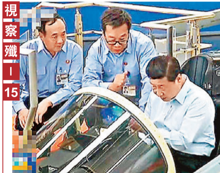
視察職 | 15 中共中央總書記、國家主席、中央軍委主席習近平8月28日至31日在遼寧考察，強調全面振興東北地區等老工業基地是國家既定戰略，要形成戰略性新興產業和傳統製造業並駕齊驅、現代服務業和傳統服務業相互促進、信息化和工業化深度融合的產業發展新格局。圖為習近平在考察瀋陽飛機工業集團時，坐進國產殲-15戰機機艙查看。 電視截圖

對於以後如何代理售賣手機號，有小代理商表示，「以後賣個手機卡還得用身份證拍照傳給大代理商，然後他們進行審核驗證後才能開通使用，要麼就是用戶買完了再去營業廳開通」。《規定》不僅將手機實名制升級為電話實名制，還首次提出對不實施、不配合的電信經營者進行行政處罰的說法。《規定》要求，電信運營商要主動實施新用戶入網實名登記，並每年組織一次對電話實名制實施的自我檢查，不配合電信管理機構檢查的，將被處一萬元以上三萬元以下罰款。