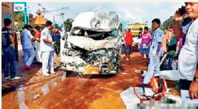
泰國沙繳府國道359發生嚴重車禍，一輛載有13名外國遊客的麵包車與前面18輪大卡車發生追尾事故。 網上圖片

香港文匯報訊 泰國一輛載有13名外國遊客的麵包車昨天在沙繳府境內與前車發生追尾事故，造成2名廣東籍遊客一死一重傷，另有2名香港遊客輕傷。目前，中國駐泰國使館正全力協助死傷者家屬赴泰處理相關善後事宜。據人民網報道，中國駐泰國大使館領事參贊高振廷昨日表示，當地時間9月1日下午14時左右，在泰國沙繳府境內發生一起交通事故，一輛載有13名外國遊客的麵包車與前車追尾，造成包括司機在內的3人當場死亡，多人不同程度受傷。據介紹，車上有廣東、香港遊客各2人，其中廣東遊客1死1重傷；2名香港遊客受輕傷(皮外傷)，經初步醫治已無大礙。目前，中國駐泰國使館已通知死傷者家屬，並正全力協助其赴泰處理相關善後事宜。