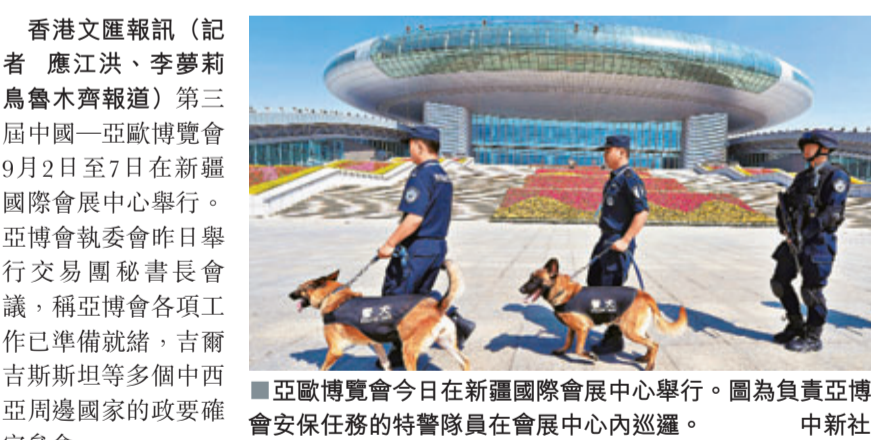
亞歐博覽會今日在新疆國際會展中心舉行。圖為負責亞博會安保任務的特警隊員在會展中心內巡邏。

香港文匯報訊(記者 應江洪、李夢莉 烏魯木齊報道)第三屆中國—亞歐博覽會9月2日至7日在新疆國際會展中心舉行。亞博會執委會昨日舉行交易團秘書長會議，稱亞博會各項工作已準備就緒，吉爾吉斯斯坦等多個中西亞周邊國家的政要確定參會。據第三屆中國—亞歐博覽會執委會副秘書長陳季介紹，出席展會的外國領導人已經確定，吉爾吉斯斯坦總理、塔吉克斯坦總理、蒙古副議長、尼泊爾前議長將參會。此外，聯合國開發計劃署、聯合國工發組織、聯合國亞太經社理事會、上海合作組織、亞洲開發銀行、國際工商會等國際組織負責人或高官將參會。