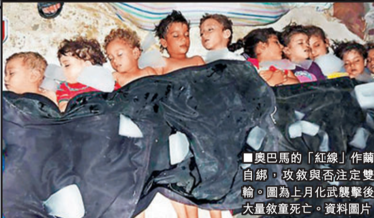
■奧巴馬的「紅線」作繭自縛，攻敘與否注定雙輸。圖為上月化武襲擊後大量敘童死亡。

奧巴馬尋求國會授權出兵敘利亞，在美國史上屬白宮向立法機關讓步的罕見案例。根據美國憲法，國會擁有宣戰權，但上次正式經由國會宣戰已是1941年美國加入二戰時。戰後歷任總統都動用三軍統帥憲法權力，未經國會同意即發動戰爭，甚至揮軍進佔他國。 越戰後，國會通過《戰爭權力決議案》，要求總統在發動超過60天軍事行動前，須先尋求國會授權，但之後多屆總統都認為此案違憲，未有遵守，例如克林頓先後多次未獲授權就出兵介入巴爾幹半島衝突。布希2003年尋求國會授權出兵伊拉克，是少見例外。 1998年美國駐肯尼亞與坦桑尼亞大使館連環爆炸後，美方導彈攻擊阿富汗與蘇丹，同樣未獲國會授權。最近一次是2011年3月，奧巴馬沒諮詢國會，而是根據聯合國安理會決議案軍事介入利比亞。 ■中央社