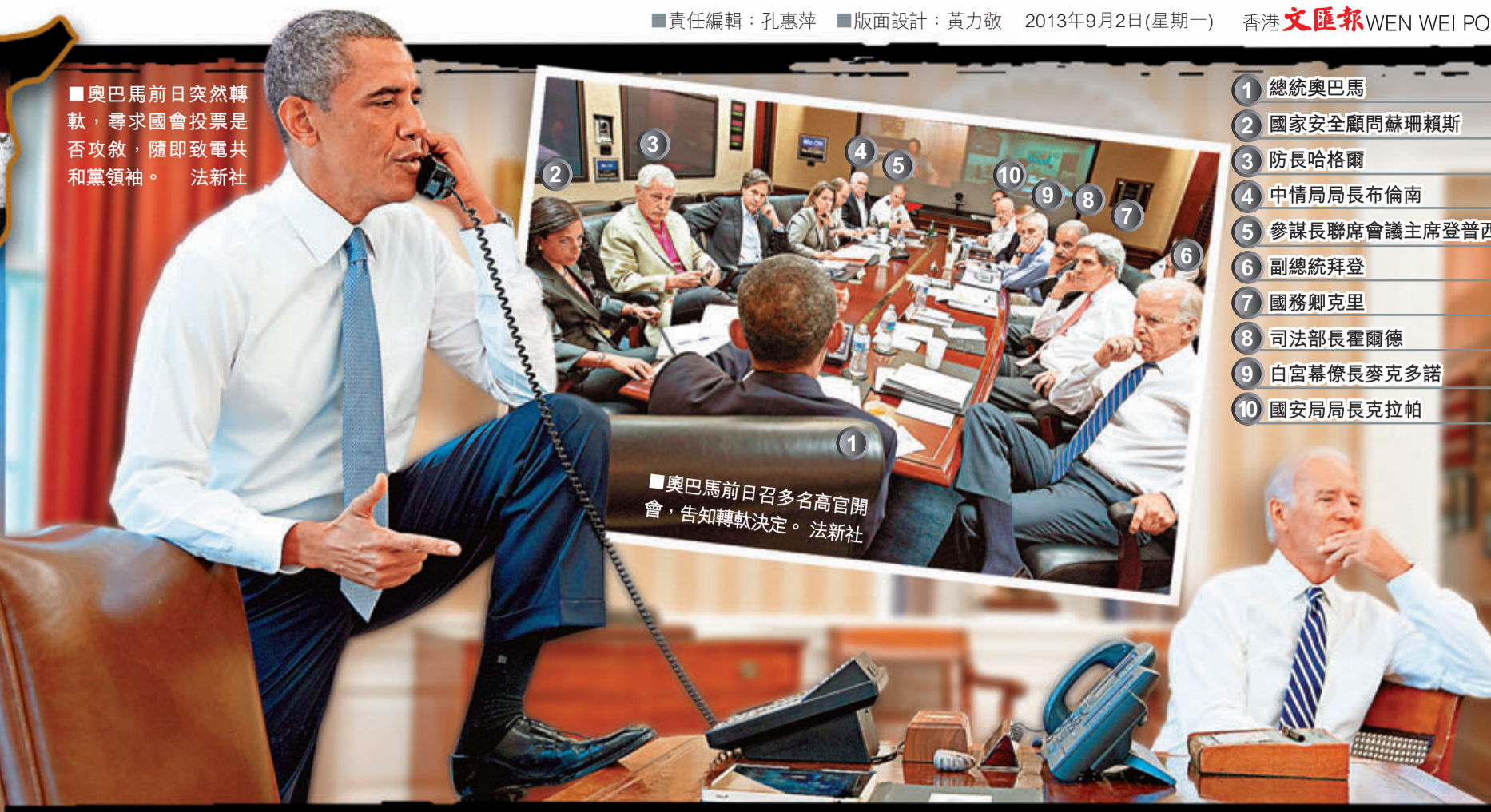
■奧巴馬前日召多名高官開會，告知轉軌決定。法新社