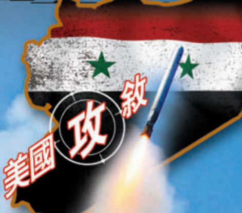
■奧巴馬前日突然轉軌，尋求國會投票是否攻敘，隨即致電共和黨領袖。