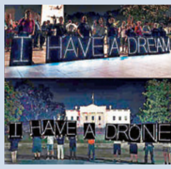
■網民無奈：馬丁路德金「我有一個夢」(上圖)變奧巴馬「我有無人機」。