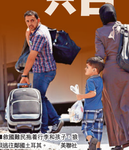
■敘國難民拖着行李和孩子，狼狽逃往鄰國土耳其。