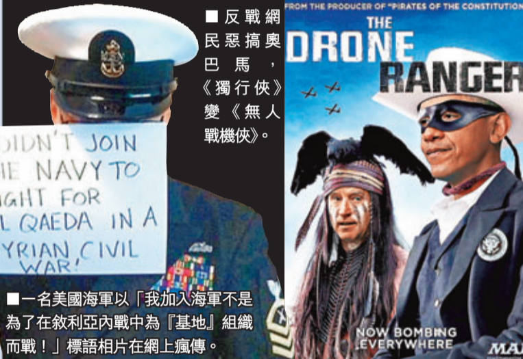
■一名美國海軍以「我加入海軍不是為了在敘利亞內戰中為『基地』組織而戰！」標語相片在網上瘋傳。