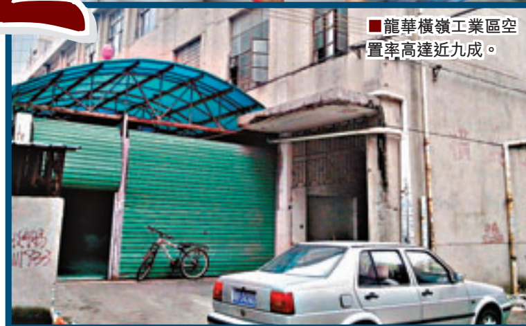
■龍華橫嶺工業區空置率高達近九成。