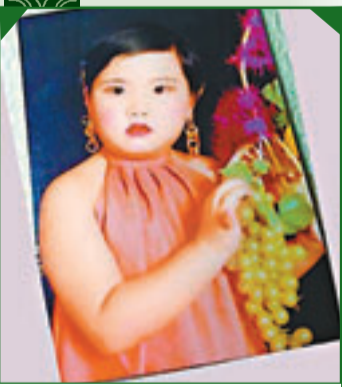
「濃妝艷抹」是這些不堪回首童年照的一個主要流派。

在网友上传的照片中，大多數在照相館拍的藝術照，都有一副「標準妝」：打腮紅、塗口紅，眉心還點上一個「美人痣」，無論男女，統統如此。另外穿古裝也是「童年囧照」的一大流派。 ■中新網