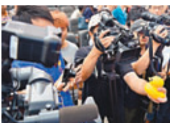
發佈會結束後媒體爭相拍攝正版玩具小黃鴨。

繼在本港維多利亞港展出後，風靡全球的明星「大黃鴨」終於游到了北京。北京國際設計周組委會前日正式公佈，大黃鴨將於9月16日至10月17日安家在北京市的園博園和頤和園。另據北京設計周組委會相關負責人透露，最終亮相的京版「大黃鴨」將高達18米，比港版的16.5米「大黃鴨」更壯觀。選址在徵求大黃鴨作者霍夫曼本人及社會各界的意見後決定，據了解，在「大黃鴨」展示期間，兩個公園都不會提高門票價格。 ■本報記者 李茜婷 北京報道