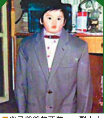
穿了爸爸的西裝，一副小大人模樣。