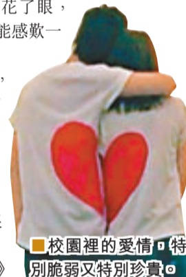
校園裡的愛情特別脆弱又特別珍貴。

有網友吐槽說，這只能說明高材生不僅智商高，情商也高。也有網友認為，該排行榜完全不靠譜，毫無科學根據。 ■《現代快報》