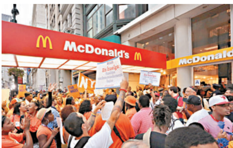
■示威者湧入麥當勞抗議。