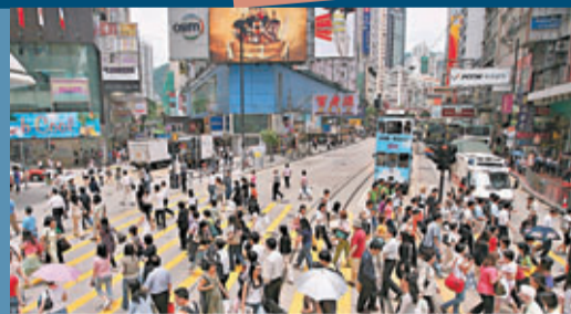
■香港在排名榜4大範疇得分高於新加坡。