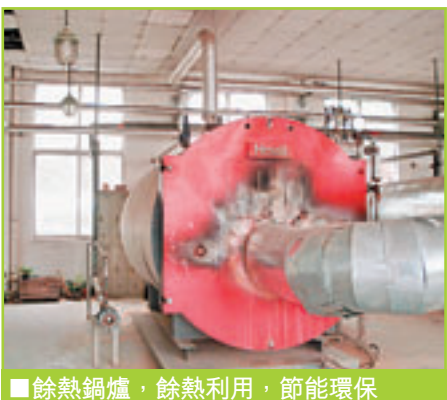
餘熱鍋爐，餘熱利用，節能環保