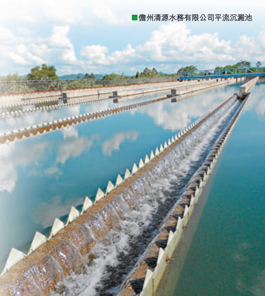
儋州清源水務有限公司平流沉澱池

水，是與國家未來命運息息相關的戰略資源。王德銀認為，如今水資源的嚴重不足以及國家對環保的高度要求，是集團進一步發展的新機遇。「我們從事水務工作，有責任為着中國水資源的更好利用和可持續發展貢獻力量；而國家實現最嚴格的水資源管理政策及對清潔能源的大力支持都是我們下一步的發展動力。在未來五年中，我們要實現日供水能力達到1000萬立方米，日污水處理能力達到200萬立方米的宏大目標，形成供水、污水處理、中水回用一體化的完整水務產業鏈。」