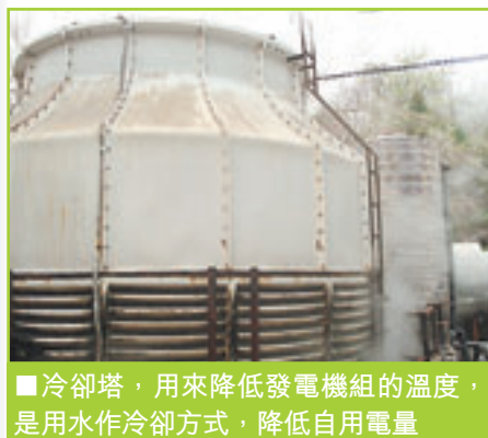
冷卻塔，用來降低發電機組的溫度，是用水作冷卻方式，降低自用電量