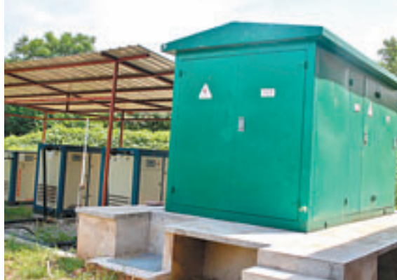
空壓機及自發自用變電櫃

水單位，減少了傳統熱水生產行業對不可再生資源的消耗。該項目不但實現了可再生能源發電，還減少了溫室氣體排放，平均每月減少碳排放1.5萬噸，年減排18萬噸。