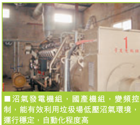
沼氣發電機組，國產機組，變頻控制，能有效利用垃圾場低壓沼氣環境，運行穩定，自動化程度高