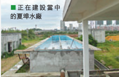
正在建設當中的夏埠水廠

目前，中國水業集團將污水處理、固廢行業(垃圾發電及污泥處理)列為重要的投資方向，積極參與各地污水處理、固廢行業項目的建設進程，並以BOT、BOO或TOT等方式開展污水處理、固廢行業的投資、建設與運營，而目前已投資的供水及污水項目分佈於山東、江西、安徽、廣東、海南等省份，並與江蘇、貴州、四川、湖南、河南等省份的城市積極洽談合作。