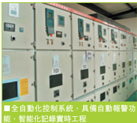
全自動化控制系統，具備自動報警功能，智能化記錄實時工程