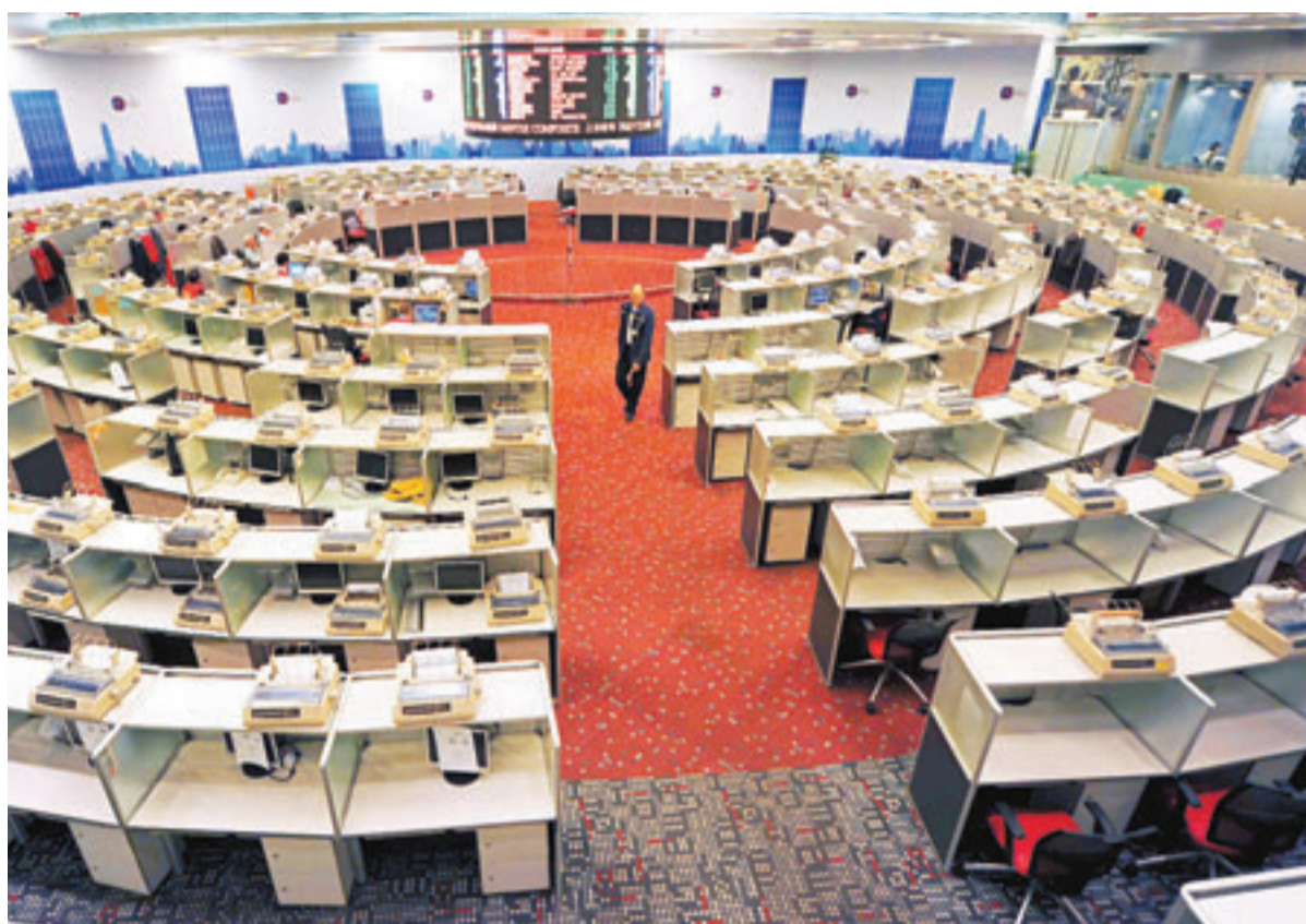
■憂敘利亞局勢，港股隨外圍下跌，收市跌350點。

中東局勢緊張，令石油股、金礦股及航空股成為大市焦點。國泰航空(0293)及東方航空(0670)分別跌3.9%及3.6%。敘利亞戰事一觸即發，黃金發揮避險作用，招金(1818)及紫金(2899)分別升5.2%及3.2%。油價升穿110美元一桶，本應有利石油股，如中海油(0883)