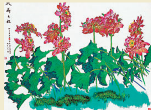
黃永玉作品《九荷之祝》北京傳真

6日當天，雖然展覽下午16時才正式開幕，但作為主人公的黃永玉上午便來到國家博物館做最後的準備。據國博副館長陳履生的微博透露，聽聞有國博工作人員將於17日舉行婚禮，黃永玉放棄了午休時間，現場揮筆為這對新人送上一幅硬筆畫賀禮，並託陳履生送上一個九十歲老人的祝福，祝新人「百年好合」如此有心實在難得。