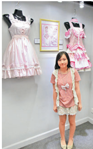
羅淑敏以櫻花及糖果蛋糕為主題設計的粉色裙裝