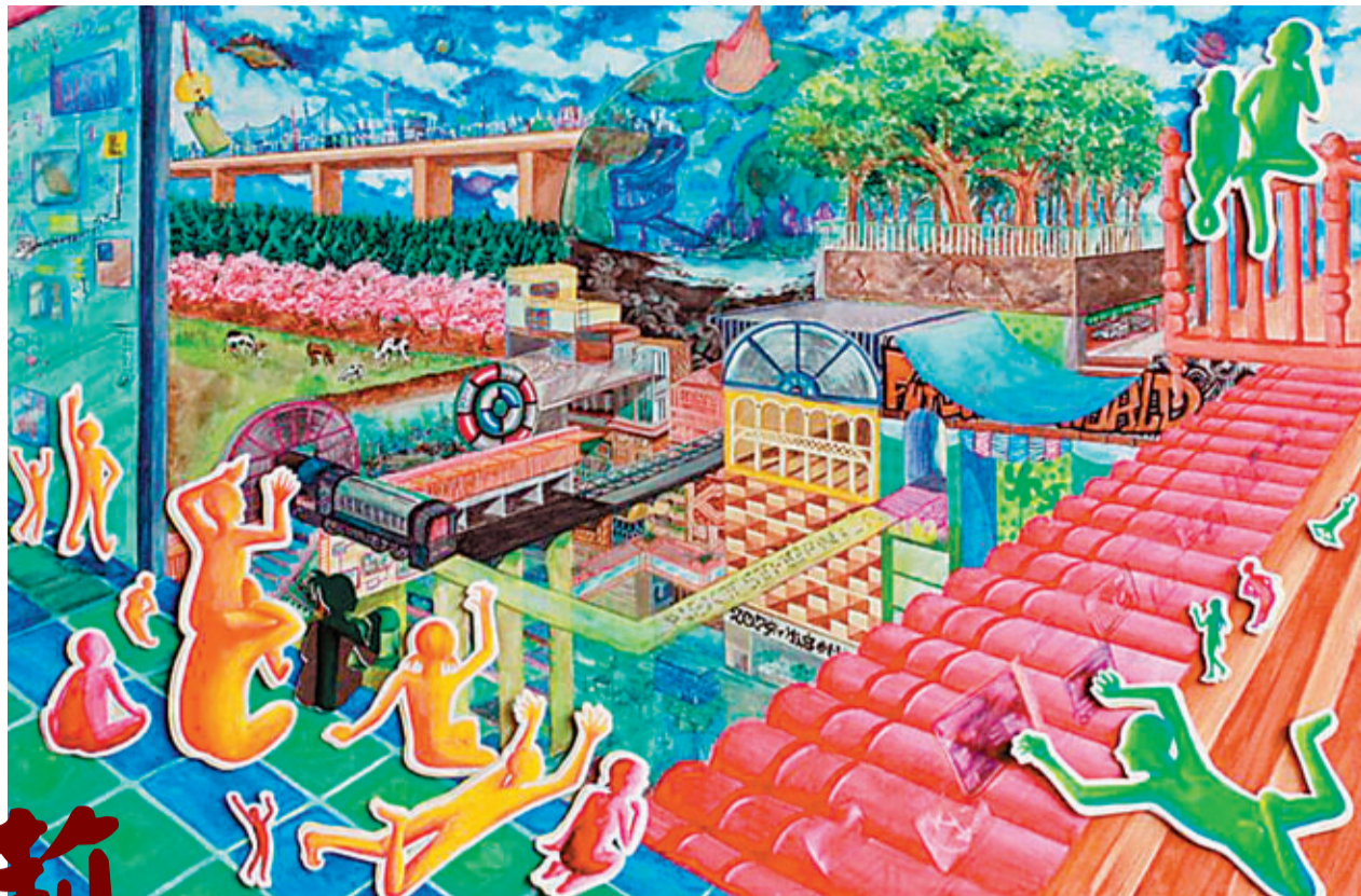
羅淑敏作品：《科技與未來》