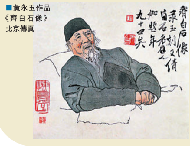
黃永玉作品《齊白石像》北京傳真