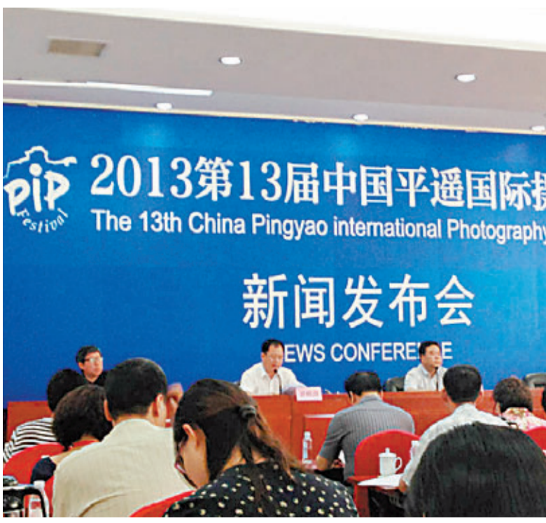
第十三屆平遙攝影展新聞發佈會

第四屆漆文化藝術節、第八屆平遙古城招商洽談會、「平遙畫」中國平遙首屆微電影節、書畫藝術作品聯展和晉商神韻文藝演出等特色活動也將在攝影展期間同步舉行。