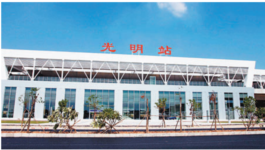
光明新區是深圳市第一個功能新區,經過近6年發展,各項經濟及社會發展指標均位列前茅。

一,大力實施園區聚集戰略和大項目帶動戰略,以高新園區為主要平台,引進了一大批高新軟優企業落戶光明。上半年,光明新區引進萬和製藥、新宇龍、靈星雨、開立科技、康桑普、富森、萬潤科技、中節能、騰佳集團及華強集團等10家企業,產業用地總面積合計34.43萬平方米,引進項目包括生物醫藥、互聯網、LED、太陽能、現代服務業、創意文化等戰略性新興產業項目。通過「以房招商」引進德國的德國儀表、台灣並日電子等10餘家優質企業項目。同時,正積極推動清華研究院、威勝