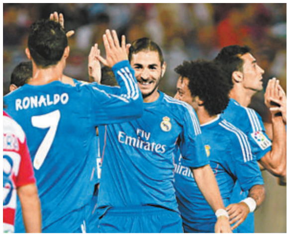
■賓施馬(中)狀態最佳。