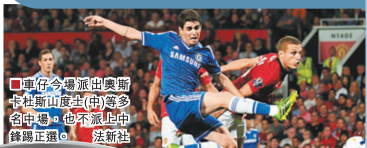
■車仔今場派出奧斯卡杜斯山度士(中)等多名中場，也不派上中鋒錫正選。