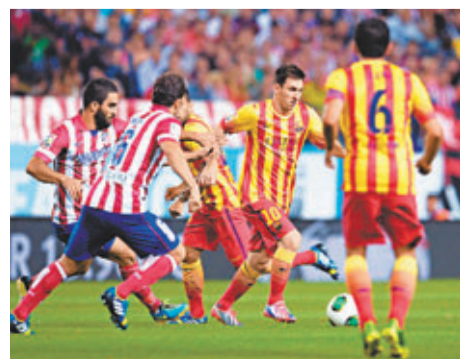
■美斯(右二)上仗只踢了半場。

面對巴塞和皇馬西甲新球季的戰況，馬體會教練施蒙尼更看好球隊的西超盃前景。他認為馬體會在前3場比賽中未失球，繼續選擇巴塞舊將韋拿和迪亞高哥斯達對抗巴塞，是個不錯的選擇。