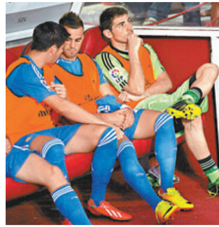
■卡斯拿斯(右)「面黑黑」。

另外，加里夫巴利將以破紀錄的轉會費加盟皇馬，但這位威爾斯飛翼日前到了西班牙後卻突被召返熱刺總部。有稱另外一強隊也加入了對巴利的搶購戰，傳聞這支球隊是曼聯。對此紅魔領隊莫耶斯卻態度曖昧地表示：「曼聯永遠會對最優秀的球員感興趣，球隊管理層與我也會尋找我們認為最優秀的球員，不管他們在哪兒。」