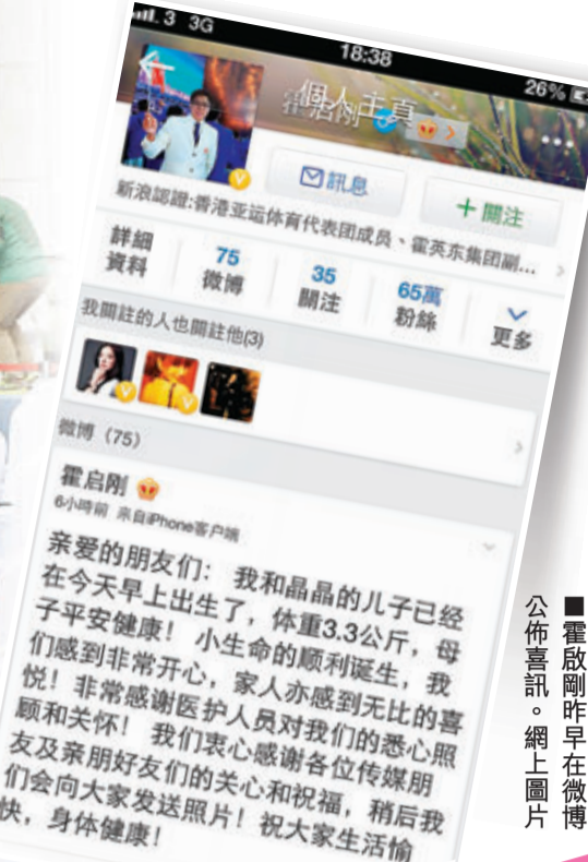
霍啟剛昨日在網上公佈喜訊。

香港文匯報訊（記者 李思穎）恭喜！恭喜！郭晶晶昨日一索得男，為霍家開枝散葉，誕下第四代男孫，為霍家上下帶來無比的喜悅！榮升父親的霍啟剛昨早透過微博公佈喜訊，透露BB重3.3公斤（約7.3磅），母子平安！但就沒表示晶晶是自然分娩，還是剖腹產子。霍震霆昨日亦有到醫院探望媳婦及孫仔，他一提到孫仔即笑笑口，指孫兒是父母的混合版，既靚仔又大隻，頭髮濃密。