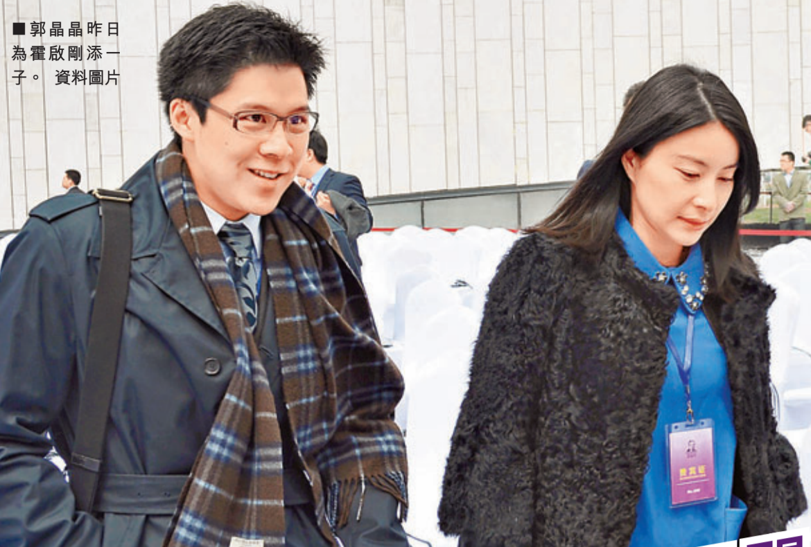
郭晶晶昨日為霍啟剛添一子。資料圖片