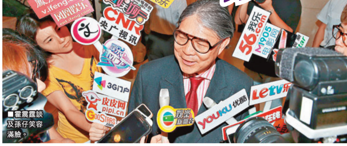
霍震霆談及孫仔笑容滿臉。