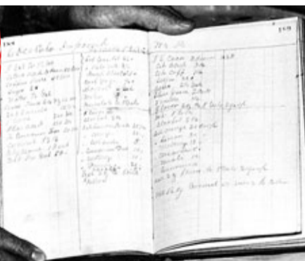
網上流傳的可口可樂配方。

可口可樂風行全球，127年來屹立不倒，目前存放於美國亞特蘭大可口可樂博物館夾萬內的神秘配方，絕對不可沒。然而配方是否真的如廠商所稱，逾百年來從無改變，可能只有有權閱覽配方的公司高層才知曉。