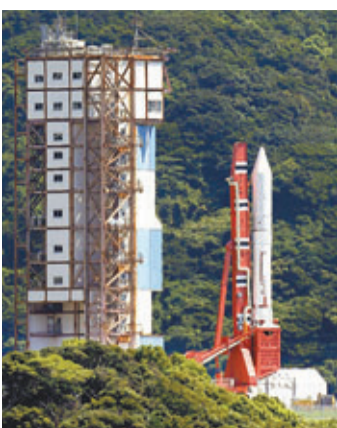
「埃普西隆」是日本繼2001年發射H2A火箭後，再次推出的新型固體火箭。 美聯社

日本時隔12年面世的最新型固體運載火箭「埃普西隆」，原定於昨日升空，但在最後階段發射失敗。日本宇宙航空研究開發機構(JAXA)正調查故障原因。火箭原定當地時間昨午1時45分從鹿兒島肝付町升空，並透過電視和網絡直播，不過倒數完畢後，工作人員即宣布停止發射。火箭造價約38億日圓(約3.1億港元)，長約24米，直徑2.6米，運用人工智能革新技術，能在發射前進行全自動檢查，並告知準備工作完成，有別於以往的人工檢查模式。它從發射台組裝到發射之間的時間，也由6周縮減至約1周。 ■美聯社/路透社