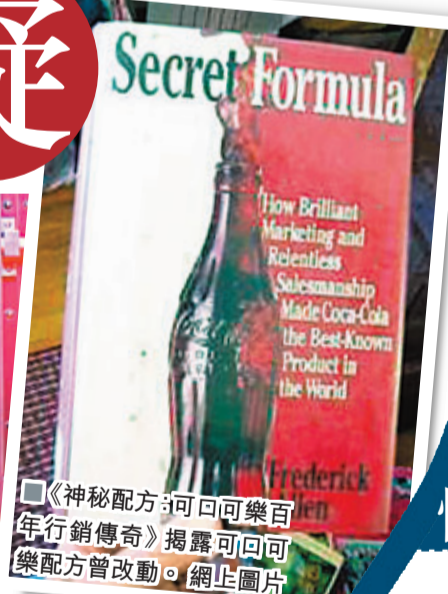
《神秘配方：可口可樂百年行銷傳奇》揭露可口可樂配方曾改動。 網上圖片

專家指，食品公司不時配合新管理規定或成本等問題而改變配方，質疑配方能否多年不變。分析稱，神秘配方已成老品牌營銷策略重心，不論配方有否改變，總會堅持「仍像最初那樣美味」的賣點。 ■美聯社