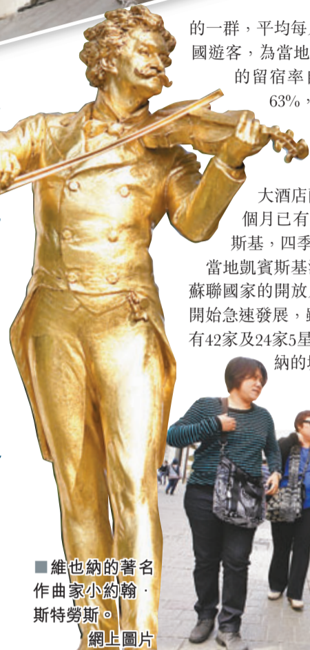
維也納的著名作曲家小約翰·斯特勞斯。 網上圖片