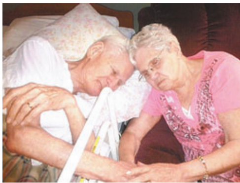
老夫婦情深得叫人感動。

美國一對結婚逾65年的夫婦在慶祝結婚66周年前夕，在療養院相隔11小時先後離世。子女指，父親健康雖然日漸變差，但仍希望時刻守護妻子，二人同日落葬。其中一名女兒指：「這是個真正的愛情故事，他們如此忠貞不二，到哪裡都要有對方作伴」。