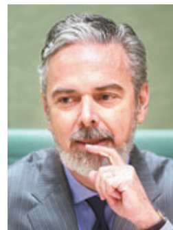
巴西外長帕特里奧塔

巴西與鄰國玻利維亞爆外交風波，巴西駐玻國大使館一名外交官上周五以人道為由，將一名因貪污罪被判囚的玻國反對派參議員秘密送到巴西境內。玻國要求巴方解釋，巴西外長帕特里奧塔前日雖宣布辭職，但旋即獲調任駐聯合國大使，分析相信這是巴方避免與玻國陷入口舌之爭。