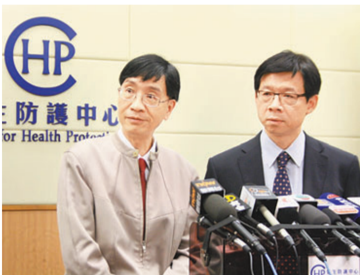
衛生防護中心指，H7N9禽流感個案會隨冬天來臨而增加，本港面對的風險相當大。

目前，全球沒有供人類使用的註冊H7N9及H7N7預防疫苗。雖然美國有2間生物公司成功開發H7N9疫苗，但據悉仍處於試驗階段，可能在未來數月開始進行首階段臨床研究，預料未能趕及在今年內推出市面。袁國勇指，醫學界有發展禽鳥用的H7N9疫苗，可是並非易事，亦未知何時才可完成，「研發針對雞隻的疫苗有3大困難。一、要確保疫苗有效；二、疫苗對雞隻無害；三、由於雞隻眾多，故疫苗需大量製造才有效，生產數量應是人類疫苗100倍」。他建議市民考慮提早接種流感疫苗，預防季節性流感，「最重要是注意個人衛生，不要接觸活家禽」。