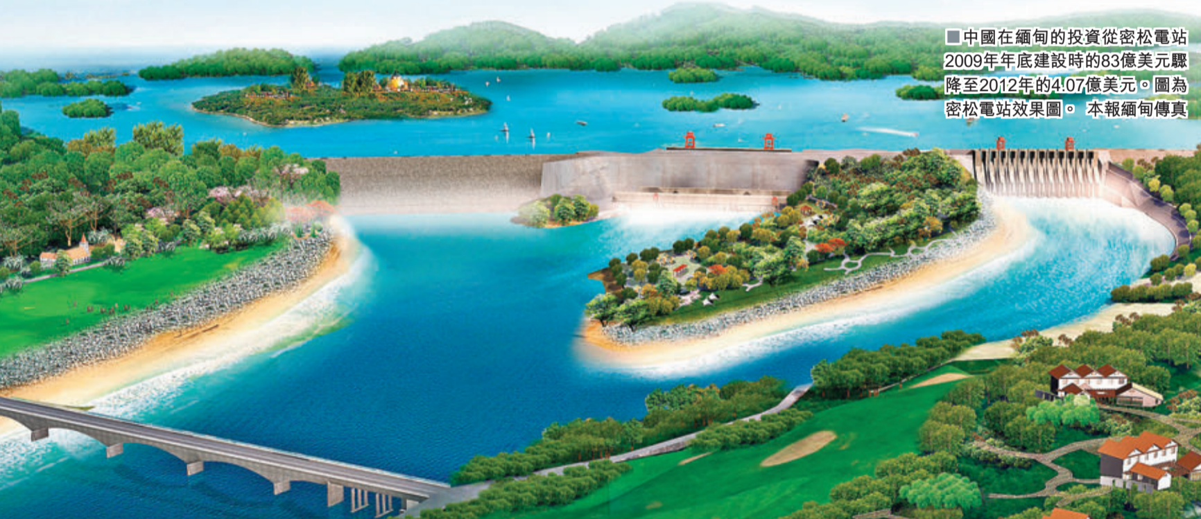
中國在緬甸的投資從密松水電站2009年年底建設時的83億美元驟降至2012年的4.07億美元。圖為密松水電站效果圖。本報緬甸傳真

作為緬甸最大的地方民族武裝，克欽族獨立軍(KIA)一直在同緬甸政府軍交戰，尋求獨立。中國在伊江投資的其他6座水電站因在雙方交火區，令項目