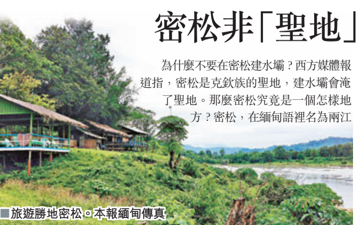
旅遊勝地密松。

那麼密松水電站大壩的安全性究竟如何？對於中國最大的一筆海外投資，中電投在密松大壩安全環保方面的評估一點不敢馬虎。中電投聘請了中緬權威專家，歷時4年時間對密松工程地震安全性技術諮詢，研究顯示密松大壩安全可靠。同時，密松大壩按照9級抗震烈度設計標準，壩體還將安裝700個安全監測設備，時刻監控大壩安全。