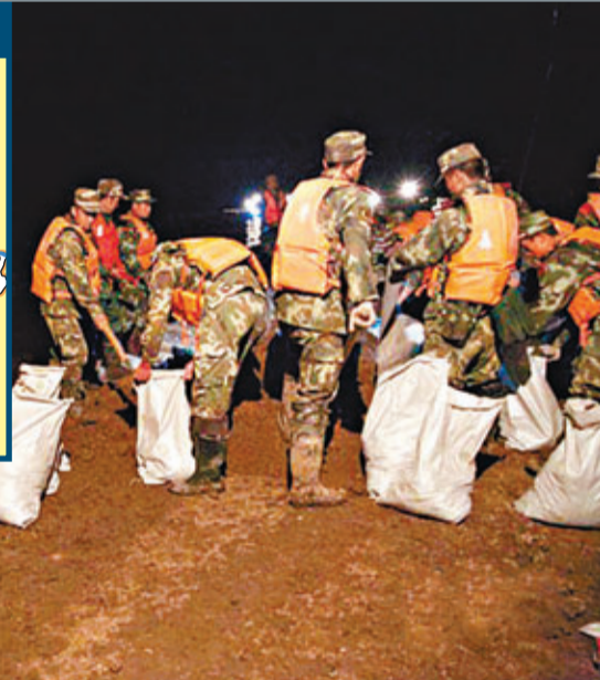
24日洪峰前夜,牡丹江森警警隊官兵在三村鎮緊急加高子堤。

香港文匯報訊(記者 王欣欣 黑龍江報道)近日連續出現險情的黑龍江幹流同江至撫遠江段24日發生超百年一遇特大洪水。其江段中俄羅斯的列寧斯克耶