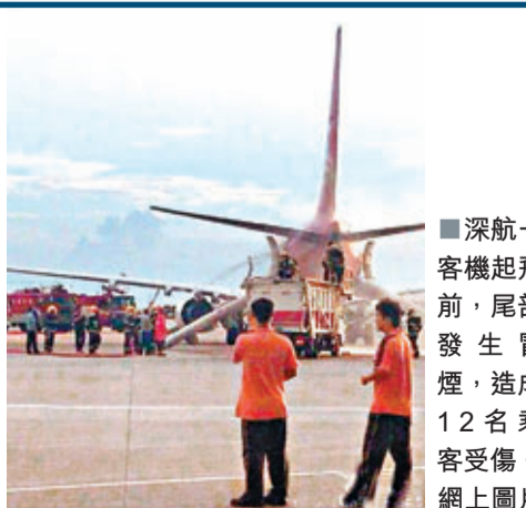
深航一客機起飛前,尾部發生冒煙,造成12名乘客受傷。

隨後,深航官網證實了這一消息。據介紹,昨晚18時10分,一家編號為ZH9969(深圳至北京)的航班,在起飛前推出過程中,APU(輔助動力系統)發生故障,觸發火警,機組及深圳機場緊急採取應急預案處置,大約10分鐘後,現場處置完畢。