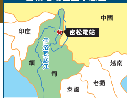
密松水電站位置示意圖

自2011年民主化改革後，被譽為東南亞最後的投資「處女地」——緬甸吸引日企、歐美大公司蜂擁而至的同時，早已在緬甸投資的中國企業卻遭遇了前所未有的挫折。中緬合作三大「千億工程」(緬幣)中的萊比塘銅礦遭遇反對遊行，緬甸最大水電站——密松水電站突遭緬甸政府叫停，商業項目政治化讓中國在緬甸投資面臨巨大風險，中企只能暗自承擔損失。本報記者近日親赴緬甸採訪，通過採訪中企在緬最大投資項目密松水電站叫停始末，向世人揭開投資新大陸緬甸的艱辛與無奈。