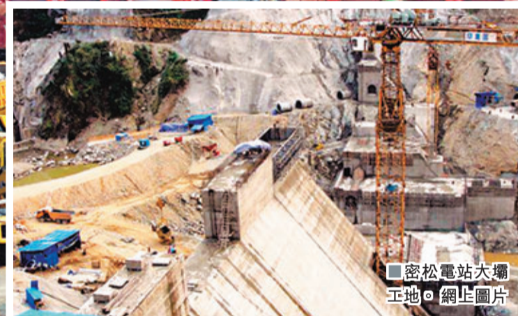
■密松水電大壩工地。網上圖片