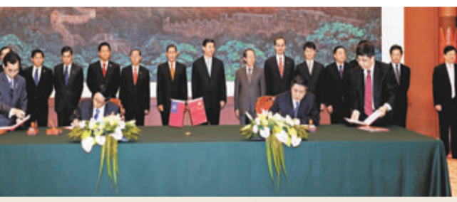
■2009年6月，在時任國家副主席習近平與緬甸和發委副主席貌埃的見證下，中緬合作簽署伊江上游水電項目協議備忘錄。

事實真的如此麼？目前，中國裝機超過11億千瓦，僅雲南省可開發的水電資源就有1億千瓦。中電投伊江上游水電有限責任公司副總經理郭庚良指出，密松水電站發電量在緬甸不可消納的部分會計劃經由雲南賣到中國。中國允許緬甸把電賣過來，實際上是在向緬甸開放了電力市場，這對任何電力輸出國均求之不得。