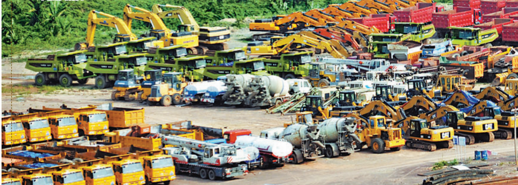
■密松水電站閒置的設備堆放在基地。