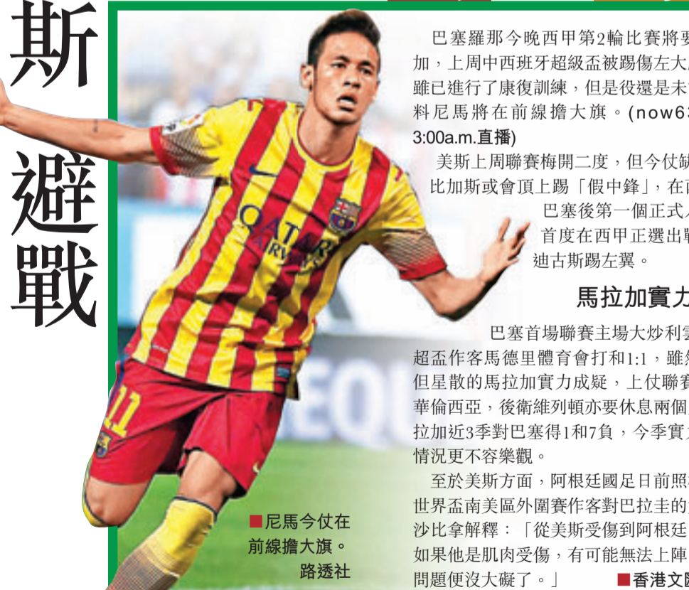
■尼馬今仗在前線擔大旗。