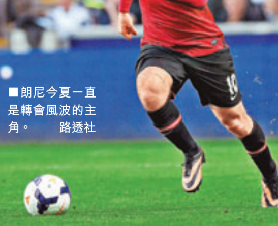
■朗尼今夏一直是轉會風波的主角。