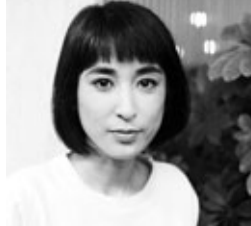
藤圭子前日疑跳樓身亡。

日本知名女歌手宇多田光的母親藤圭子前日疑跳樓身亡，據負責安置其遺體的人員引述藤圭子的前夫、音樂製作人宇多田照實的說話，按照藤圭子生前的意願，她死後將不會有喪禮儀式舉行，而火葬日期等詳情則還未有落實。此外，昨日藤圭子的遺體已由新宿警察局移往靈堂安置，宇多田照實陪伴在側，而宇多田光則未有會見記者傳媒。此外，現年73歲的日本歌手兼演員內田裕也前晚在Twitter發文悼念，表示他們曾見過幾次面，記得對方喜歡搖滾，帶有一種黑暗的感覺。