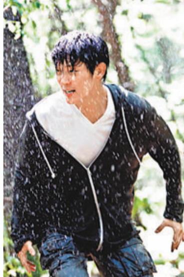
李準基在雨中逃亡。

此外，蘇志燮主演的新劇《主君的太陽》繼續穩坐該時段收視冠軍寶座。在前晚播出的劇情中，蘇志燮向孔孝真坦承患有閱讀障礙，及後待孔孝真睡着，他更輕握對方的手，令收視率創下16.6%的佳績。