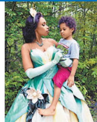
珍妮花赫遜帶同兒子到拍攝現場。