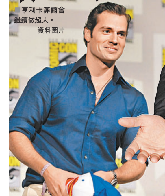
亨利卡菲爾會繼續做超人。