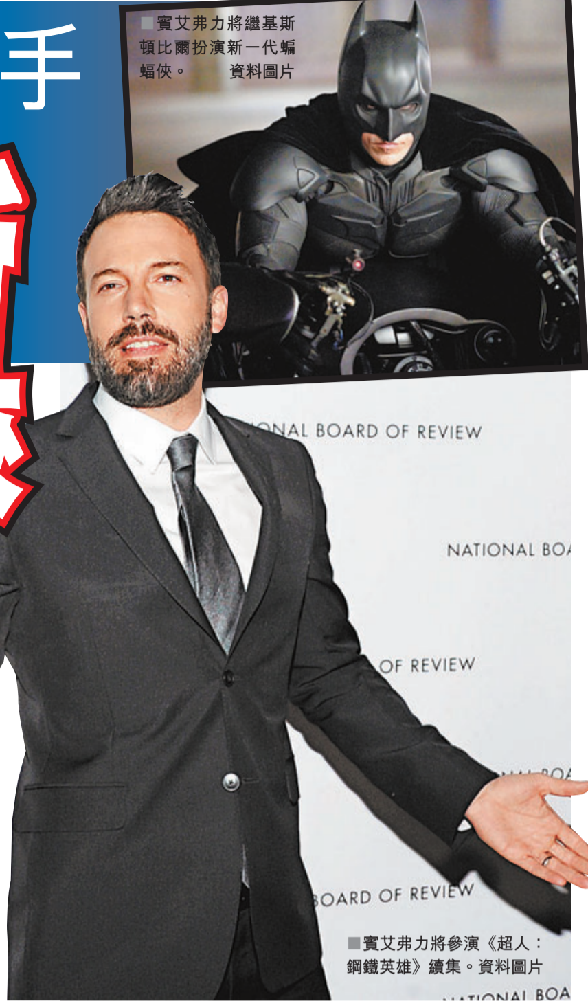
賓艾弗力將繼基斯頓比爾扮演新一代蝙蝠俠。